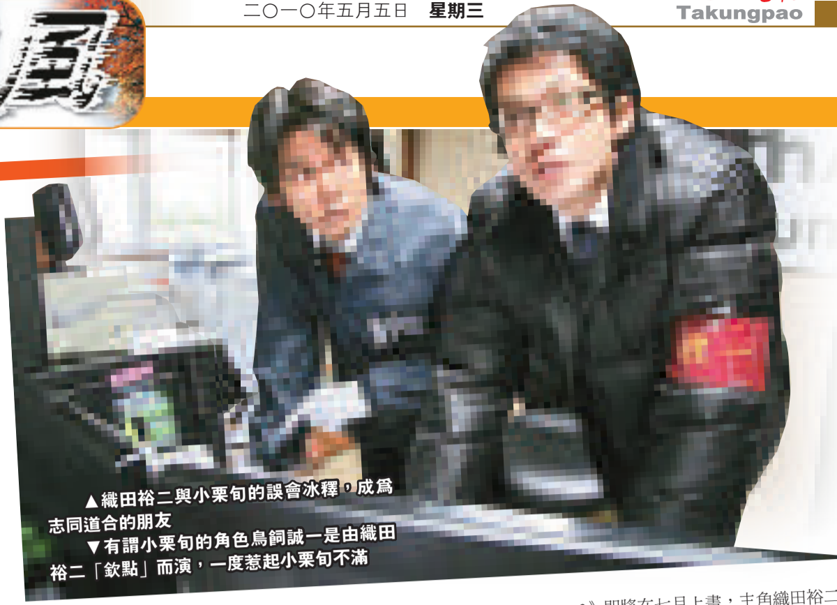
▲織田裕二與小栗旬的誤會冰釋，成為志同道合的朋友 ▼有謂小栗旬的角色鳥飼誠一是由織田裕二「欽點」而演，一度惹起小栗旬不滿