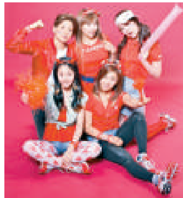
▲「f(x)」推出新碟《Nu Abo》，會上電視節目唱live ▲女子組合「f(x)」在網上公開她們兒時的照片