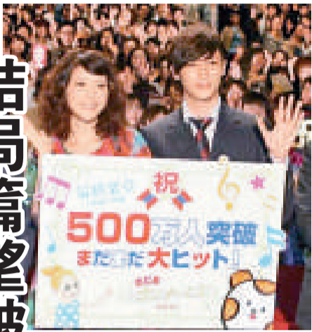
▲上野樹里對《交響情人夢》系列完結感到不捨 ▶電影票房暢旺，上野樹里（左）與玉木宏一同到戲院答謝觀眾