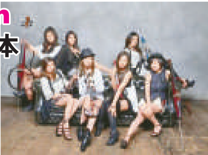
▲內地七人女子樂團「Beijin」將於八月在日本推出大碟

「Beijin」融合了古典樂和時裝潮流兩大要素，七名成員以一身新潮打扮演繹古典樂，予人耳目一新的感覺。樂團曾於歐美和韓國等地演出，曾演唱過北京奧運會的主題曲《2008 飛翔》。樂團於一月時到日本為大碟錄音，並苦練日語，對進軍日本顯得甚有決心。