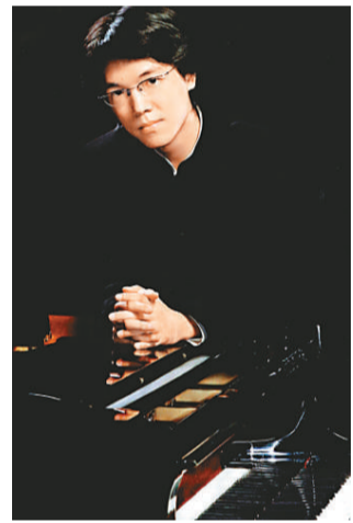
▲泛亞交響樂團客席指揮廖國敏