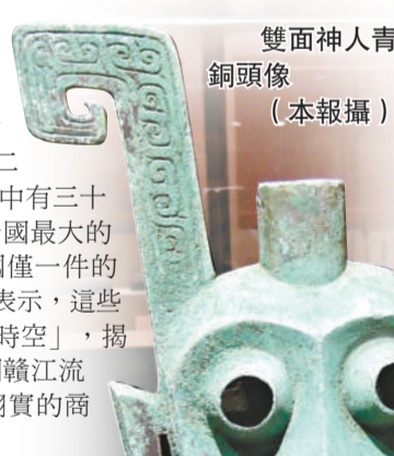
雙面人首青銅頭像

「商代遺珍——江西新幹大洋洲出土文物精品展」日前在深圳博物館老館開幕。此次展覽共展出了江西省贛江中游新幹大洋洲的一百二十五件（套）出土文物，其中有三十件屬國家一級文物，包括全國最大的「伏鳥雙尾青銅虎」和全國僅一件的「雙面人首銅器」。主辦方表示，這些珍貴文物可帶領觀眾「穿越時空」，揭開三千多年前中國商代時期贛江流域的神秘面紗，展現生動翔實的商代江南生活畫卷。