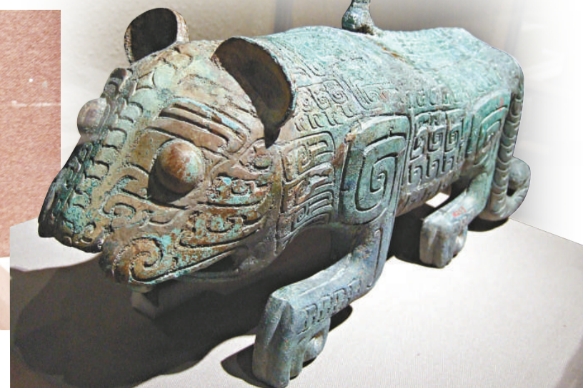
▲伏鳥雙尾青銅虎