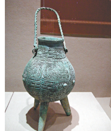
▲獸面紋三足圓腹青銅甗

作「三把傘」，「三把傘」距離贛江邊約一百米。堤堤隔上幾年就要修一修，為了取土方便，鄉親們就地取土，對「三把傘」挖山不止。一九八九年九月二十日，村民挖土準備加高贛江堤時發現青銅器，遂啓動考古發掘工程。