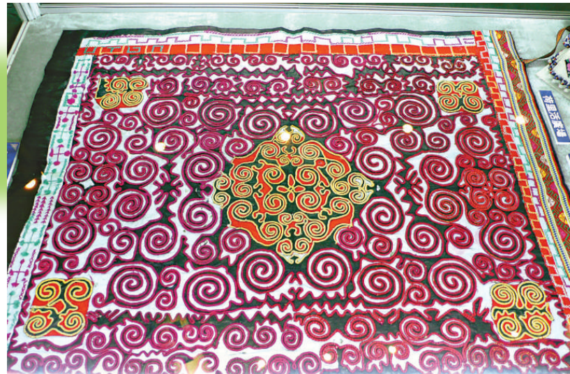
▲貴州省劍河苗族的「渦旋紋背扇」