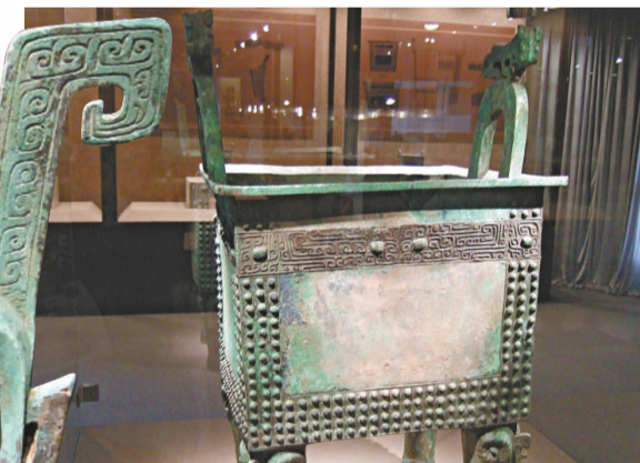
銅器爭奇鬥妍，交相輝映，共同展示了贛江流域商代文明的最高水平。