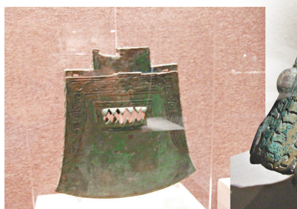
▲雲雷紋青銅鏡 (本報攝) ▲伏鳥雙尾青銅虎 (本報攝)