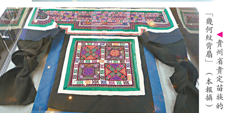
▲貴州省貴定苗族的「幾何紋背扇」