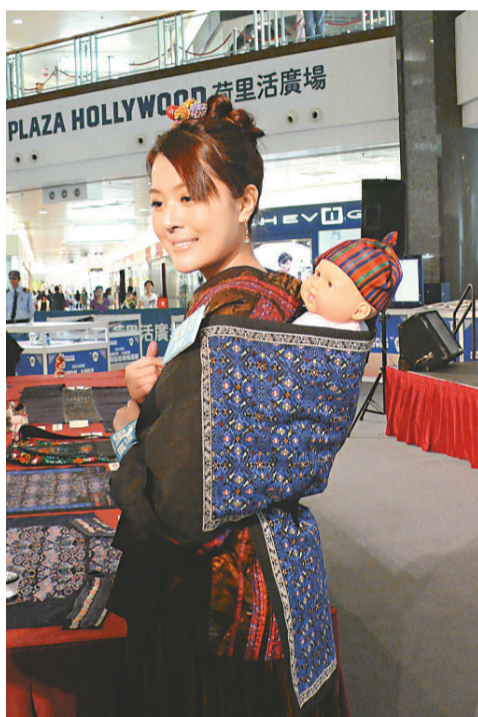
▼模特兒示範用貴州婦女預帶