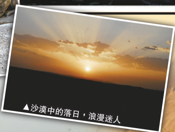
▲沙漠中的落日，浪漫迷人