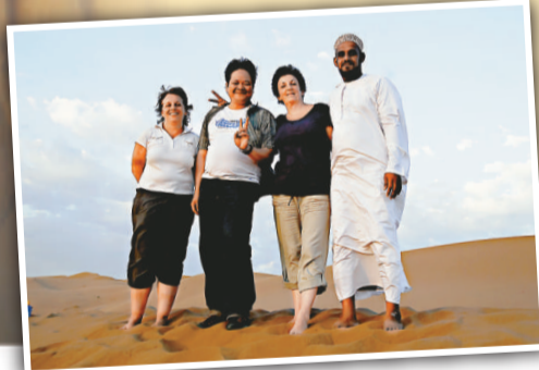
▲筆者(左二)與來自法國的旅客及阿曼人(右一)在阿曼沙漠中合照

阿曼蘇丹國是一個漂亮的國家，自然環境優美。考察期間，筆者親身體會到阿曼人的友善及好客，特別要感謝阿曼新聞部全人的悉心安排及照顧。行程中，筆者不止一次被受訪者提議去學習阿拉伯語言，好適應越趨舉足輕重的伊斯蘭經濟浪潮。筆者相信，隨着阿曼的經濟政策逐步推行，經濟規劃逐一落實，阿曼未來的國民經濟將會更為興旺，社會更為發達。