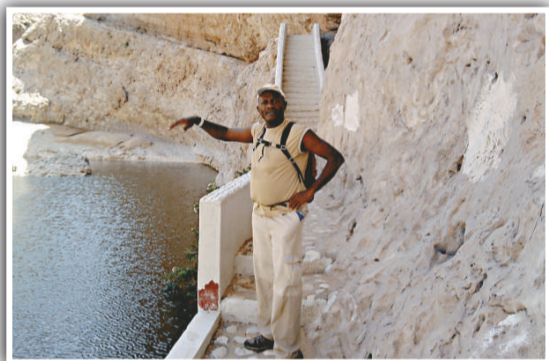
▲遊客喜到阿曼作生態旅遊

順帶一提，阿曼首都馬斯喀特的國際機場由於接近飽和，故當局正在興建新機場，預期在2015年竣工。待新機場建成後，將可為更多旅客服務。