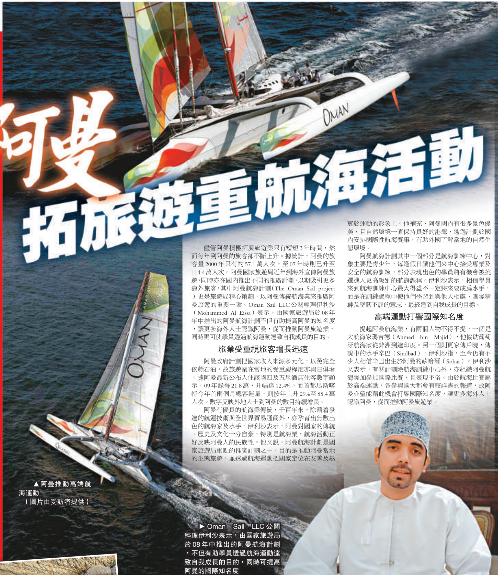
▲阿曼推動高端航海運動

阿曼人與周邊國家人士都會穿上很類似的伊斯蘭服裝，然而阿曼人(Omani)卻容易被辨認出來。傳統上阿拉伯人都較為樸素，衣服包括頭巾以白色為主，但阿曼男人的服裝雖仍以白色為主，但頭巾顏色卻五花八門，絕不比女孩服裝遜色，加上在白袍上右邊領口的招牌繩結，被認是其他阿拉伯國家人士的機會很低。阿曼女人方面，則要從面罩着手，大部分阿拉伯國家女人都會戴上只露出眼睛的面紗或面罩，但阿曼女人的面罩卻另成一格，露出大部分面孔來，更甚者根本不戴任何面紗或面罩呢。順帶一提，阿曼的房屋與其服裝一樣以白色為主，但當中不乏色彩鮮艷的屋子，反映當地人民性格開朗。