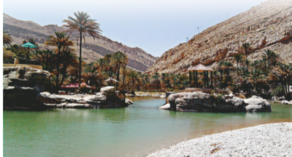
▲阿曼的自然景色怡人