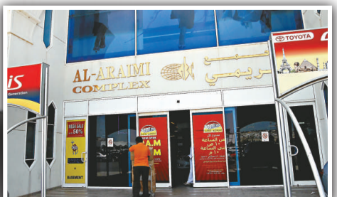
▲中型綜合商場 Al-ArAIMI Complex

Al-Raid Group的商場已有15年歷史，目前正計劃擴充業務。阿拉伊美說，馬斯喀特的城市規劃完善，這情況大大有利商場發展，因為在一個社區內，各商場大都有各自的主題，每每這個商場賣某類貨品，另一個商場則賣另外一些，故不構成直接競爭，顧客亦可隨自己所需到各自喜愛的商場購物，這情況對各方都有好處。