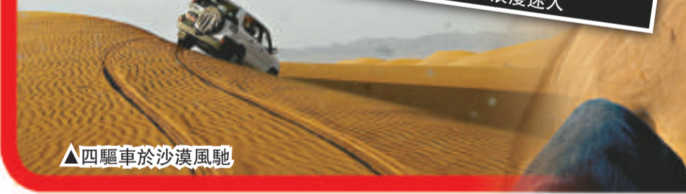
▲四驅車於沙漠風馳