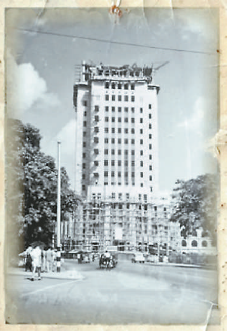
►40年代後期興建中的中國銀行大廈