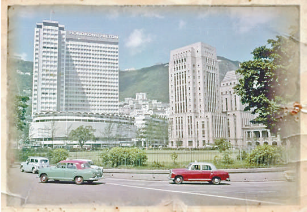
▲70年代的中國銀行大廈（右），左為已拆卸的希爾頓酒店，前方草地為遮打花園的前身「香港木球會」