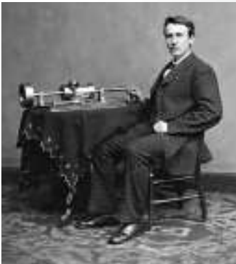
▲愛迪生和他發明的留聲機

話說回來，愛迪生的主要發明就是在這間實驗室誕生的。包括1876年發明了大大提高電話通話質量的炭粒話筒；1877年發明了使他舉世聞名的留聲機；以及1879年的「黑暗中的太陽」炭絲電燈泡，以