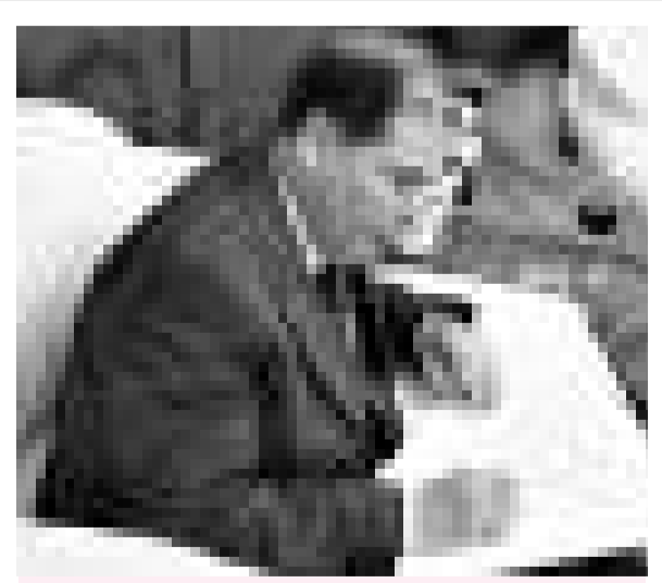
▲馬耳他總統阿貝拉 (資料圖片)

「颯露紫」和「拳毛騧」於1914年被盜運到海外。在過去的幾十年中，多位考古學家及社會知名人士曾建議「昭陵六駿」能在中國團聚，但卻一直未能實現。當年「二駿」被運抵美國時，是由一個個碎塊拼接起來的，近百年過去了，「二駿」有點「不負重荷」。來自西安的三位文物修復專家，將對「二駿」的外觀修復提出決定性意見。事實上，「二駿」經歷了上千年的自然侵蝕以及人為破壞，被盜前已經破損嚴重，沉積了許多塵垢，在被盜時又蒙受了「肢解酷刑」，其修復工作並不是一件容易的事情。(新華社)