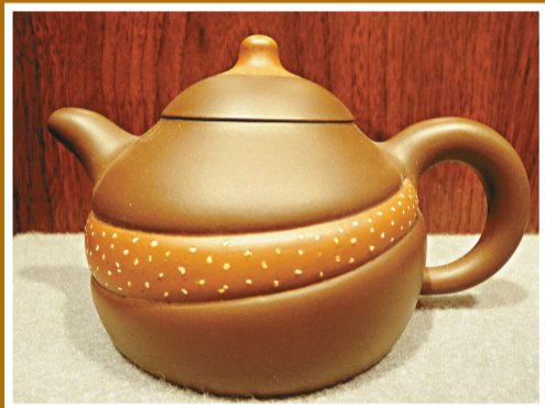
中國四大美女系列壺之一，《西施浣紗》