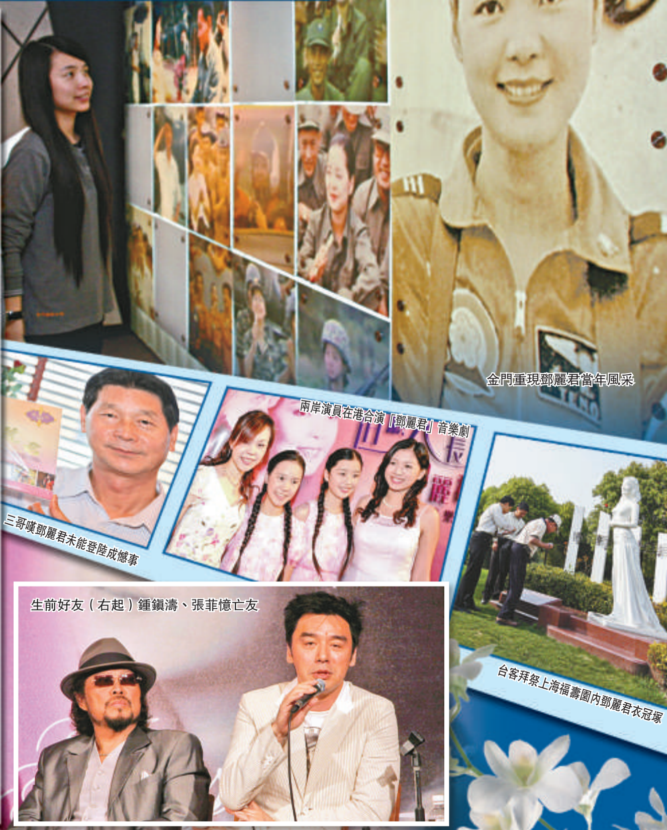
金門重現鄧麗君當年風采