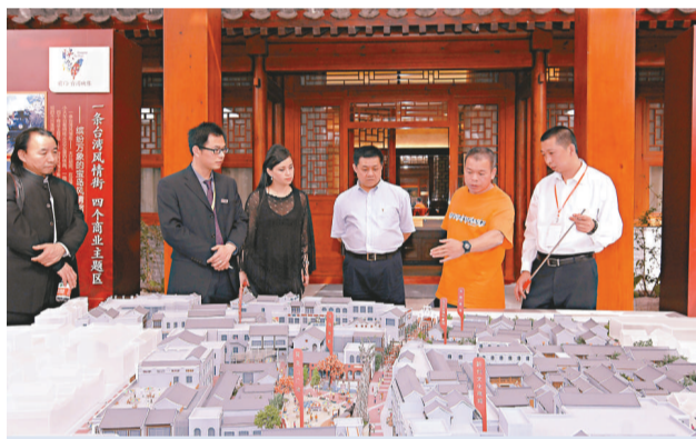
台商參觀大陸唯一一所台灣會館

連戰先參觀了重新修繕裝飾的台灣會館。會館內用照片和文字展現了整個台灣會館的歷史進程。連戰在開幕式上表示，台灣會館於1893年建成，2年後台灣被日本佔領，台灣同胞再未有機會來到此地。今次台灣會館重新開張，有助加強兩岸交流與互惠合作。