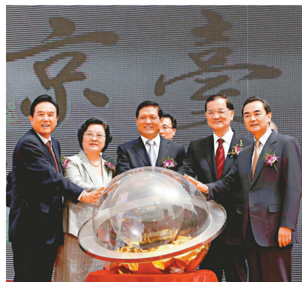
連戰(右二)、劉淇(右三)、王毅(右一)、陳雲林(右五)等為台灣街開街

題寫街名。親民黨主席宋楚瑜和新黨主席郁慕明也分別題贈了「玉山會館」牌匾和「集萃樓」牌匾。