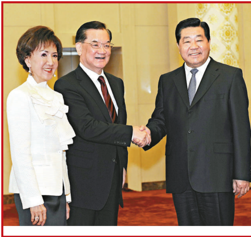
賈慶林(右)昨日在京會見連戰及夫人