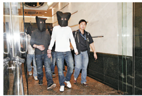
▲警員在行動中拘捕37名男女押返警署扣查

昨日凌晨四時左右，西九龍總區反黑組、特別職務隊、機動部隊聯同油尖警區特別職務隊，合共約六十人，展開「天網」行動，帶同兩頭緝毒警犬，掩至該間樓上吧會所突擊搜查，與混入場內的臥底探員裡應外合，分別在貴賓房地下及部分顧客身上，合共搜出三十克懷疑「K仔」毒品，市值約五千元，將場內三十七名男女拘捕，以黑布蒙頭由多輛警車押返警署扣查。