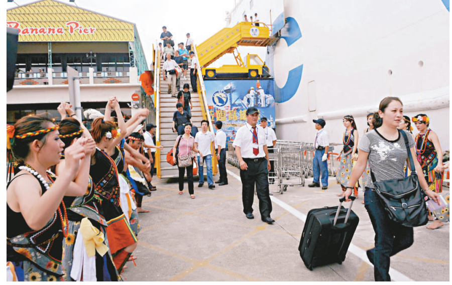
▲搭乘「中遠之星」輪抵達高雄港的旅客下船，當地青年男女載歌載舞歡迎

也有旅客說，日前金門機場航班經常受濃霧影響，旅客行程受阻，如果搭乘海運應可避免行程受延誤的旅遊風險。