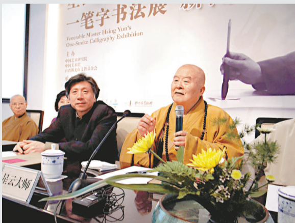
▲星雲大師與中國美術館館長范迪安出席新聞發布會

此次展覽的書法作品之中，既有佛教經典語句如「無上士」、「世間解」、「不忘初心」、「悲智雙運」等，更有與人們生活緊密相關的哲思妙語，如「活在當下」、「活出希望」、「淡泊人生」、「福從心生」、「仁者無敵」、「不動如山」、「口說好話，心存好念」等。