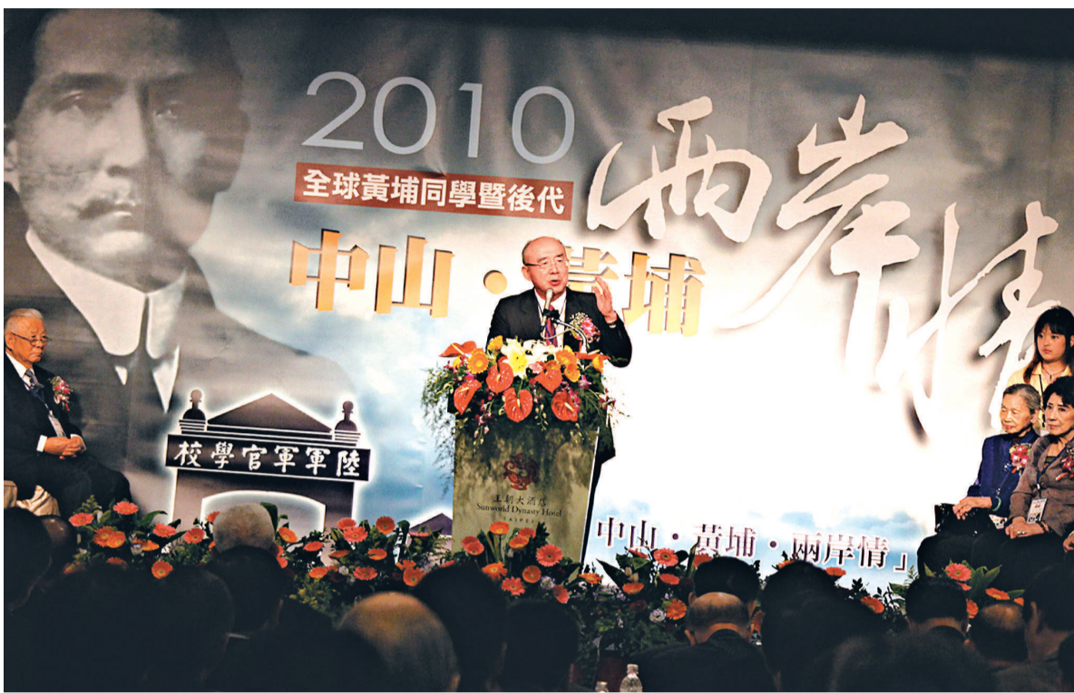
▲國民黨榮譽主席吳伯雄應邀在2010中山黃埔兩岸情論壇開幕式上致詞