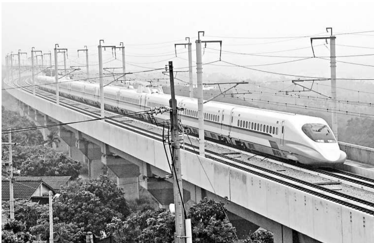
▲台灣高鐵貫穿南北，是島內民眾和遊客喜歡的交通工具

據高鐵調查，肇事的駕駛員有睡眠障礙但不就醫，2個多月來僅服用友人提供的安眠藥，4月24日當天上午和4月23日晚上都吃過安眠藥，當天4點30分發車後半小時即出現異狀，醫院檢驗報告顯示他體內有安眠藥成分，因他服用來路不明藥物還勉強服動，違反高鐵運輸安全規定，5月3日被高鐵解僱。