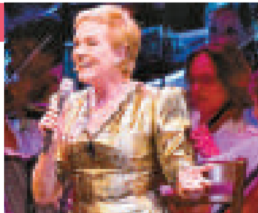
電影《仙樂飄飄處處聞》女主角茱莉安德絲日前在英國舉行的演唱會遭到猛烈批評

茱莉安德絲曾表示希望這場預計可帶來一百萬英鎊票房收益的表演，能成爲一次國際巡迴演出的鋪路石。上周，茱莉安德絲接受《每日電訊報》的採訪時坦承：「我已不能像以前那樣唱