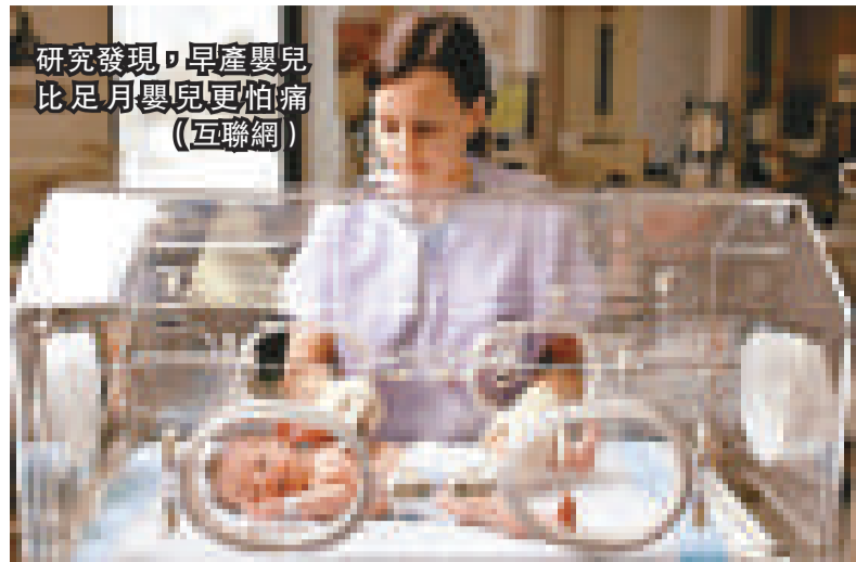
研究發現，早產嬰兒比足月嬰兒更怕痛

貝盧斯科尼的財富估計在50億歐元到80億歐元之間。貝盧斯科尼的第一次婚姻有兩個孩子，現在都在他的媒體公司擔任高級職務；他與維羅妮卡生有三個孩子，分別是芭芭拉、利奧諾拉以及盧吉，三人中後兩人已經成年，並且在貝盧斯科尼的企業中任職；芭芭拉將在今年夏天畢業，希望掌控父親的出版帝國。