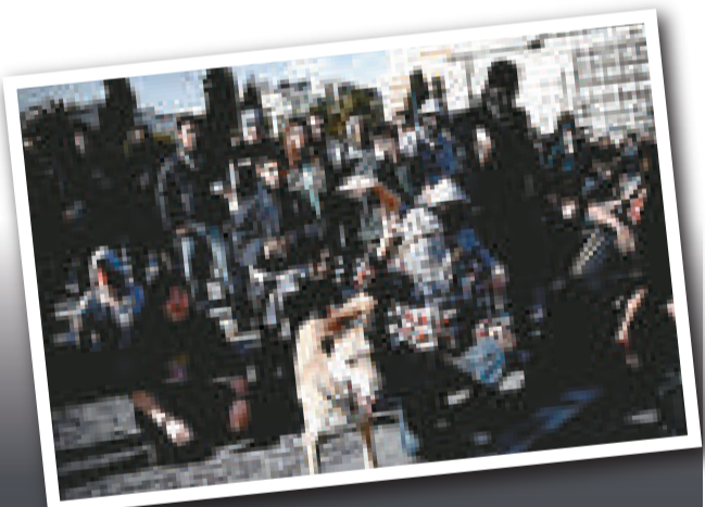
希臘一隻黃狗自2008年起，「參與」過不下10次的抗議活動（互聯網）

經營O2的公司AEG說，如果有人要求退票，該公司將個別處理，但堅稱該場演出的廣告，已清楚說明茱莉安德絲的獨唱部分，僅會佔演出的一小部分。（英國《每日電訊報》）