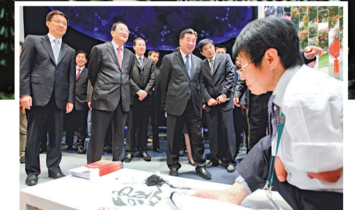
▲國務院副總理回良玉(右三)、上海市委書記俞正聲(左二)、上海市市長韓正(左一)參觀生命陽光館