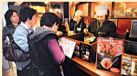
▲日本產業館38元一份的章魚丸子頗受遊客青睞

上海市商委副主任張新生今天透露，本月1日至7日，世博園內商品銷售日均達508萬元，而餐飲日均銷售亦達560萬元，這兩大數值在本月8日分別超過660萬元以上。在談及世博特許商品時，他說，世博會已開發了29個大類共1.8萬餘款產品，其中已有逾1.1萬種上市銷售，「世博特許商品已在全國形成了5500多家銷售網點，銷售額超過140億元」。