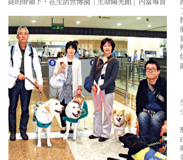
▲在日本訓練員的引導下，與四隻來自東瀛的「世博導盲犬」在上海機場合影。

【本報記者倪巍晨上海十日電】上海浦東機場邊檢今天迎來了一批來自東瀛的特殊客人，四隻日本導盲犬「小Q」。據了解，這四隻導盲犬將在日本訓練員的帶領下，在生活世博園「生命陽光館」內當導盲義工。