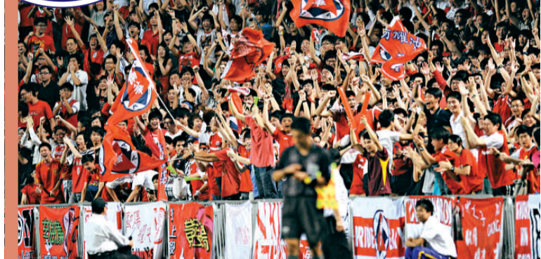
▲當南華追成1:2時，大球場上的球迷非常興奮