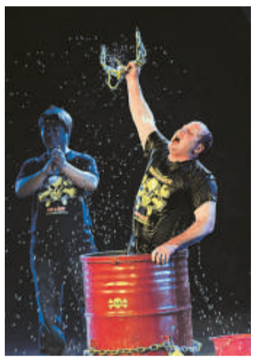
▲加拿大迪恩逃脫魔術

此次雜技魔術節突出高水準、國際化、娛樂性和創新性，展示極品雜技的驚險奇幻，展示頂級魔術的精妙絕倫，呈現出時尚新潮、「魔」力四射、特色鮮明。期間，還舉行了中華張姓始祖揮公受封得姓紀念大會暨濮陽張姓研究會成立十五周年儀式，飛向太空——中國載人航天暨國家航天高新技術成果展，三省七市陳氏太極拳嫡傳弟子交流大會，市情說明、項目推介及簽約儀式，水上藝術燈展、瘋狂飛車表演等一系列經貿和旅遊活動。