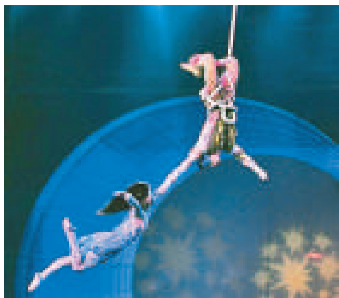
▲豪華集團雜技《立繩》