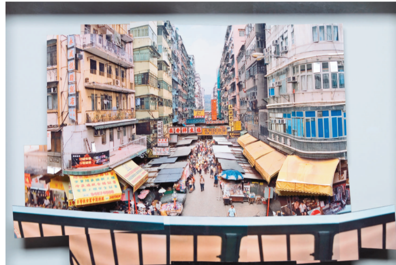
▲葉家偉《香港影像：花園街》

》（中國繪畫）、許寶馴《行草書自書文》（中國書法及篆刻）、周晉《浮》（中國繪畫）。