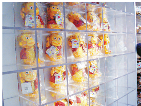
▲馬來西亞館禮品區的金絲猴公仔惹人喜愛 本報攝

「我剛才看到了2000多元的金筆，筆身都用銀絲打造，不過沒捨得買，我剛買了世博特色印章。」