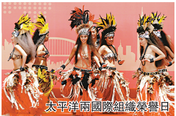
太平洋兩國際組織榮譽日

這次美術大展由國務院僑務辦公室、中國美術家協會爲指導單位，上海市政府僑務辦公室、上海世博會事務協調局、上海市文學藝術界聯合會、上海市美術家協會主辦。