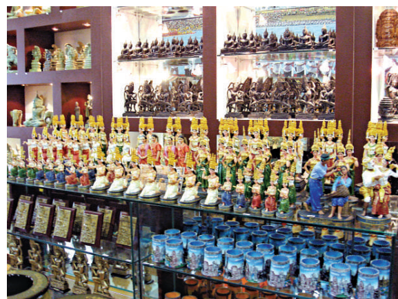
▲東埔寨館禮品區陳列了特色人偶擺設，奪人眼球

較之世博特許飾品和服飾外，店內的各類紀念幣、玉佩、玉璽等貴重特許商品，不僅具有保值價值，同時還附加了紀念意義。若對貴重特許品不感興趣，手鏈、項鍊等單價60元至70元不等的小玩意兒，想必也是不錯的選擇。一圈逛下來，最受青睞的商品不言