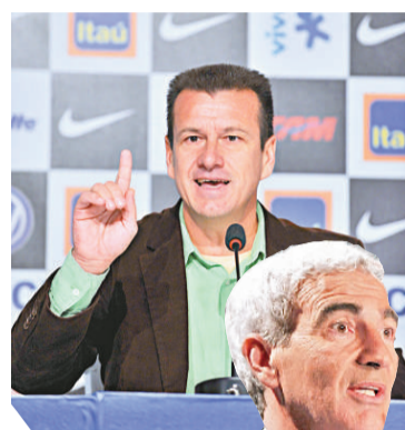
◀鄧加鐵腕治軍獲民眾認同

馬拉當拿同時強調，他希望國家隊球員能夠盡早集訓，展開世界杯的備戰工作。由於阿根廷足協的組織工作不得力，參加球隊行程至今沒有確定。馬拉當拿明確表示，他希望所有球員都能一起出發前往南非，而且必須乘坐商務艙，確保球員旅途的舒適，而自己則不介意坐經濟艙前往南非。