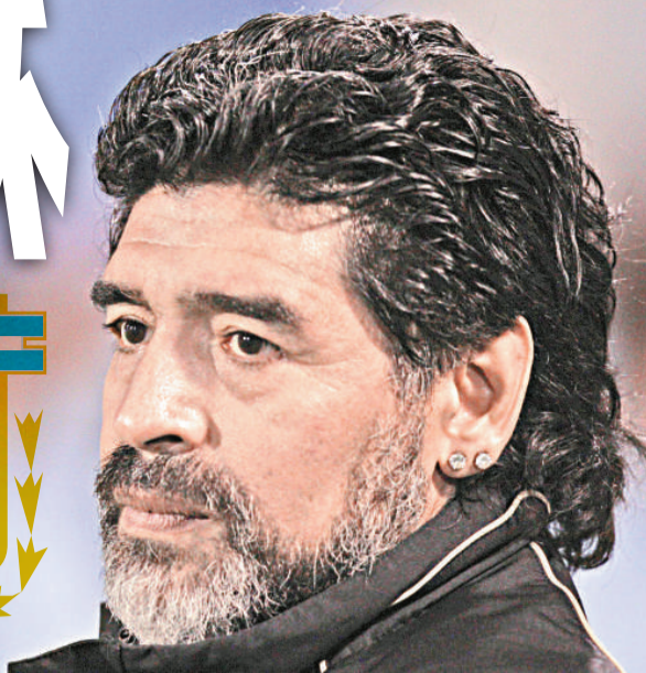
▶馬拉當拿對阿根廷足協辦事不力很惱火

根據阿根廷足協的安排，他們將於本月24日在布宜諾斯艾利斯的紀念體育場同加拿大隊進行一場熱身賽。馬拉當拿本來也不希望打這場熱身賽，但是由於比賽早已敲定，因此他未有反對。根據阿根廷隊教練組的計劃，入選的球員將從本月20日開始在阿根廷足協總部進行集訓。24日的熱身賽結束後，球員們將獲得幾天時間休息，然後就會啟程前往南非。阿根廷隊原計劃在抵達南非前在迪拜舉行一場熱身賽，但是因為組織比賽的公司失誤，導致比賽無法進行，令馬拉當拿非常惱火。