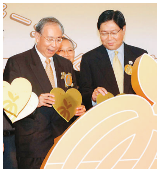
2005年時任政務司司長的許仕仁(左)與財經事務及庫務局局長馬時亨為強積金投資教育推廣計劃主持揭幕儀式

綜合各步驟所得的資料，撰寫一篇時事評論，並可利用右方的評核表來衡量自己或同學的表現。