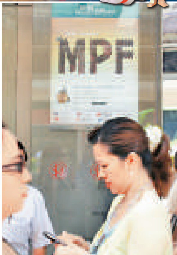
強積金半自由行政策推行後，預料可提高強積金受託人的競爭，從而令基金的投資效益增加。圖為一間銀行門外張貼的強積金宣傳海報

此外，我們可到公共圖書館或在互聯網搜集相關的新聞報道及評論。以下是核准強積金受託人的一覽表： http://www.mpfa.org.hk/tc_chi/reg_use/reg_use_amt/reg_use_amt.asp