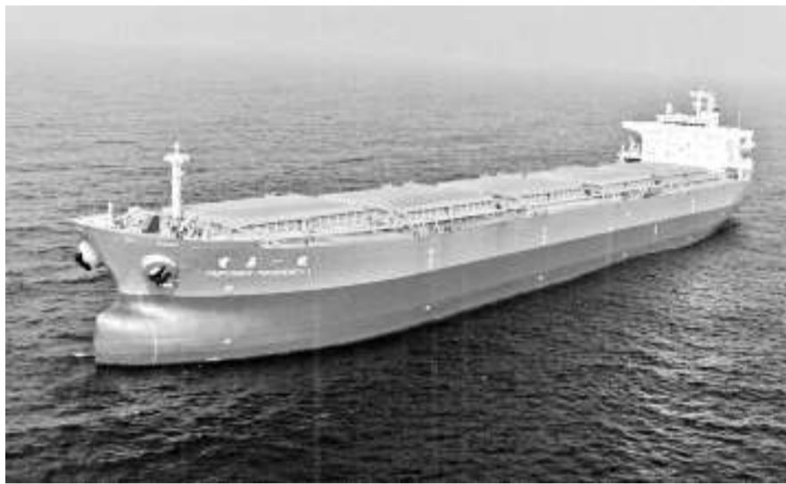
▲巴拿馬型船成為船東搶手貨，二手船價與期租金急升不止

乾散船市場前景叫好，帶動二手船買賣活動增加，二手船價在過去數周已顯著上升。滙豐船務服務發表的海運週報指出，儘管過去數天二手船買賣成交量減少，但仍有不少潛在買家頻頻問價