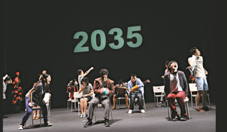
▼《變奏》結尾預示二〇三五年的轉變