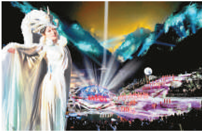
▲《天門狐仙·新劉海砍樵》以高山奇峰為背景

【本報記者程明越深圳報導】由湖南省委宣傳部主辦，張家界市委、市政府承辦的《天門狐仙·新劉海砍樵》新聞發布會昨日上午在深圳國際會展中心舉辦。湖南省委常委、宣傳部長路建平，中國山水實景演出創始人梅帥元，著名作曲家、上海世博會文化大使譚盾等出席了新聞發布會。 《天門狐仙·新劉海砍樵》是世界上第一台以高山奇峰為背景，以山間峽谷為舞台的山水實景演出；也是目前世界唯一一台在山水實景中演出並有完整故事情節的音樂劇。天門山壯美瑰麗的奇峰險壑、峽谷裡的飛瀑流泉、空中的霧嵐飛煙、山上的林木花草皆成為該劇舞美效果的構成元素，也成為該劇實現特殊藝術表現力和巨大視覺衝擊力的獨特資源。