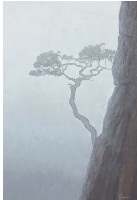
▲油畫《嚮往陽光》（二〇〇九年）