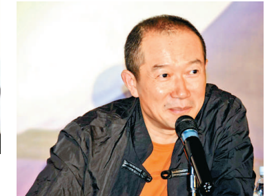
▼《天門狐仙·新劉海砍樵》音樂藝術總監譚盾

民幣，演員隊伍五百三十多人，由中國山水實景演出創始人梅帥元和著名作曲家、上海世博會文化大使譚盾分任總策劃、總導演和音樂藝術總監。該劇取材於湖南家喻戶曉的民間故事《劉海砍樵》，汲取張家界獨特的民歌、民舞元素進行藝術創作。用悲傷、歡樂、笑容和淚水交合成一個跨越人間仙界、愛情天塹的動人故事。《天門狐仙·新劉海砍樵》的舞台背景是在天門山風景區山門口至天門山頂的整條峽谷，峽谷兩側奇峰列陣，天門洞凌空高懸。整個舞台與峽谷、奇峰、森林、溪流飛瀑融為一體，自然天成。 梅帥元和譚盾在新聞發布會上表示，要對此劇進行再提升、再完善，努力打造成世界音樂劇的不朽經典，與張家界的絕美山水一樣，向世界展現湖湘文化的獨特魅力。他們還表示，要進行《天門狐仙·新劉海砍樵》室內版的創作，期望打造出世界級的劇場版《天門狐仙》在美國百老匯上演，在世界巡演，使之成為代表中國音樂劇藝術成就的文化名片，向世界展示中國文化的魅力。據了解，該劇自二〇〇九年九月正式公演以來，除去冬季正常停演外，約四個月的時間已有近十五萬國內外遊客到場觀看。《天門狐仙·新劉海砍樵》的運營方表示，他們還將在舞美特效和視