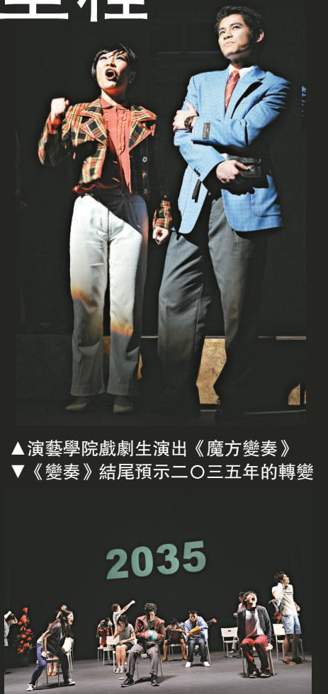
▲演藝學院戲劇生演出《魔方變奏》