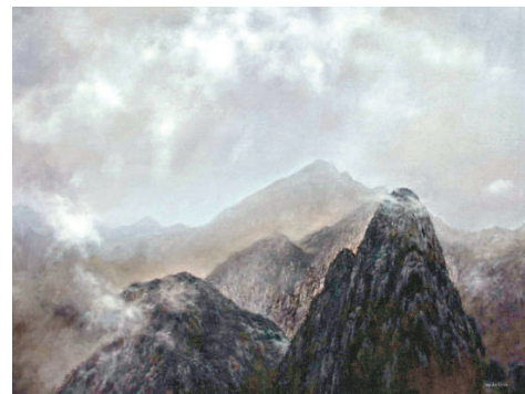
▲油畫《雨後黃昏》（二〇〇七年）