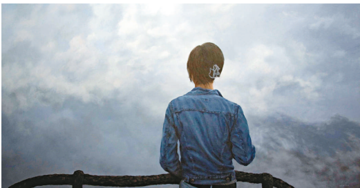
▲油畫《雲中百合》（二〇〇九年）

林德在展覽開幕式上表示，創作並展出「黃山」系列是他向壯麗山河致敬的方式，這些地方正是中國古典繪畫靈感的源泉。希望此次展覽可以在中國過去所創作出的曠世佳作的基礎上做一些有價值的貢獻，同時能激勵當代藝術家，讓他們被這些山巒的奇秀而感動。透過他的作品，希望能傳達這一自然風光的神秘與魔力，並引起觀眾的共鳴。