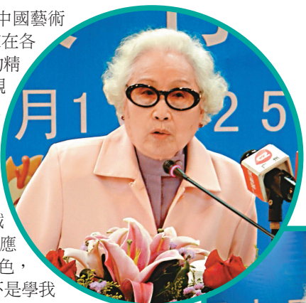
▶女姐為記者贈送的書上簽名 ▶女姐與記者分享自己的從藝經歷

粵劇《刑場上的婚禮》將在本屆藝術節中角逐文華獎，女姐坦言對該劇抱很大期望。而女姐在粵劇成功申遺之後曾表示面臨缺乏劇本和年輕演員的窘境。女姐指這兩個方面都不是短時間能解決的，不過女姐認為不用太悲觀，粵劇在城市以外的地方很有市場，有廣東人的地方就會有粵劇。女姐稱自己最擔心是沒有創作隊伍，將來無新戲可演。女姐像「工作狂」，不工作不行，如今年紀大了，女姐不能化妝上台演出，但是她的聲音保持得非常好，因此之前她花了很長時間創作了第一部粵劇動畫《刁蠻公主戀駙馬》，並親自導演、配音。女姐說「衰在無做到廣大宣傳」，因此今年7月她打算把片子拿出來重新宣傳推廣，如果觀眾反應好她願意再拍一部粵劇動畫。