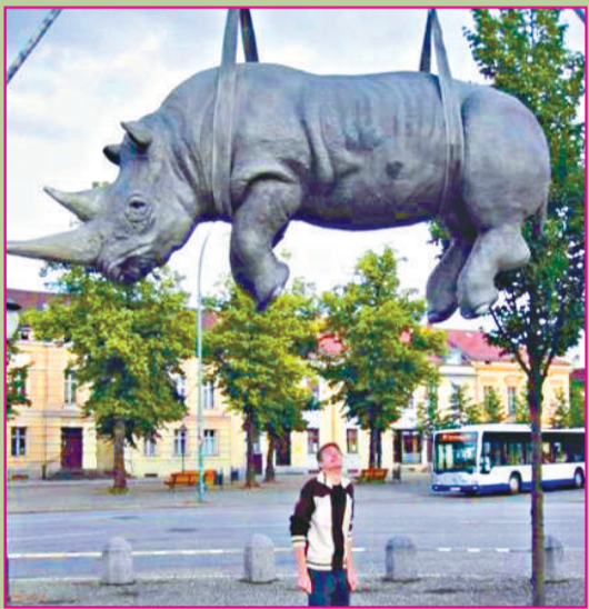
▲懸掛着的犀牛 德國波茨坦