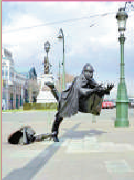
▲起義者與警察 (比利時布魯塞爾)