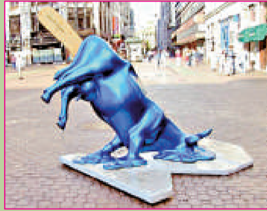
▲溶化的奶牛 羅馬尼亞希達佩斯特