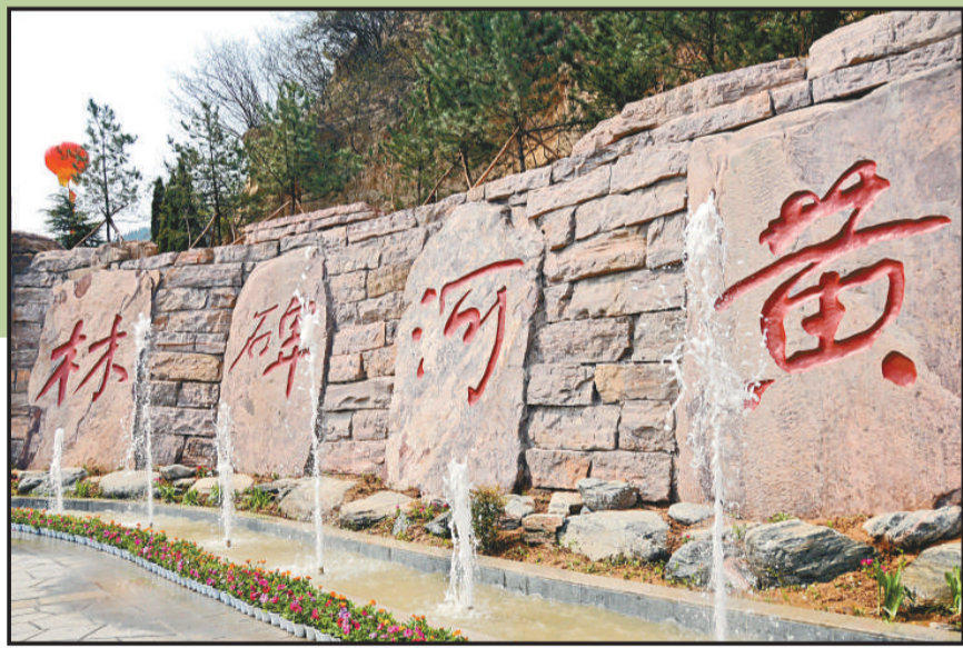
▲黃河碑林四月十七日在河南鄭州開園