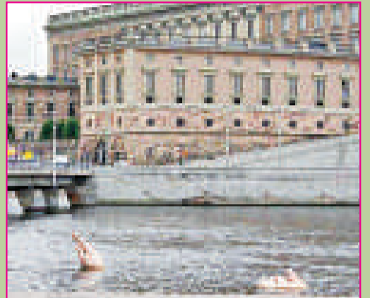
▲無題 (瑞典斯德格爾摩) ▲打結的跑腿 (日本金沢市)