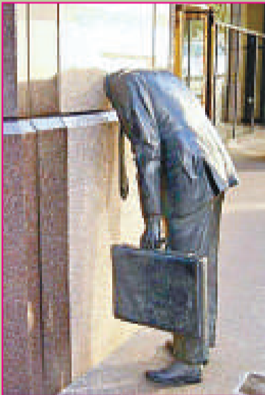
▲恩斯特揚大廈外的雕塑 (美國洛杉磯)