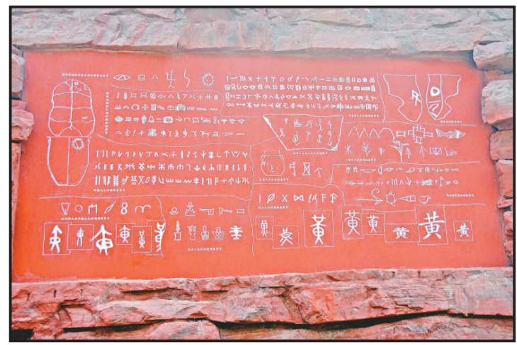
▲近百米長的文字起源牆