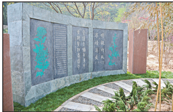
▲黃河碑林歷經20餘年勒石刻碑近1200通