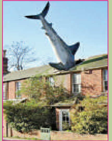
▲鯊魚 (英國倫敦牛津希丁頓)