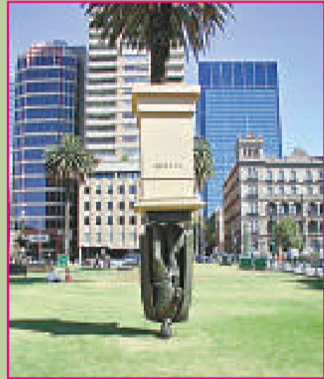
▲無題 (澳洲墨爾本拉籌伯大學)