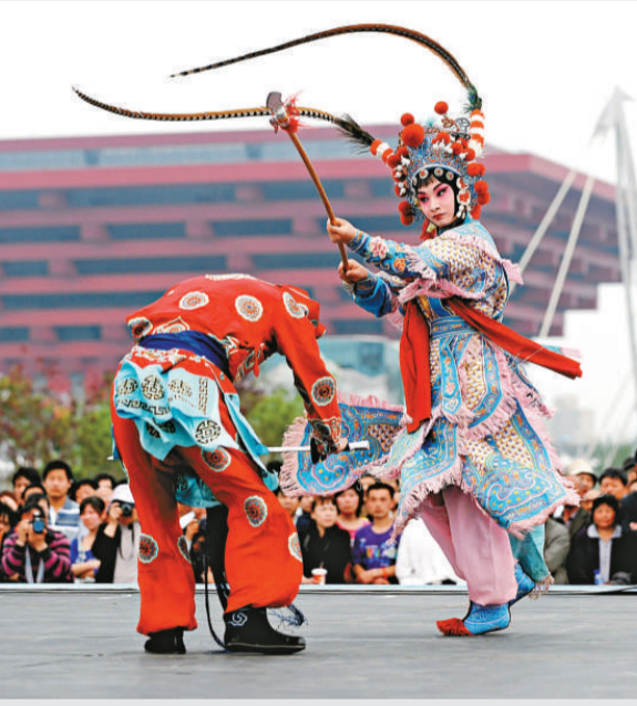
耍花槍 演員在世博園慶典廣場表演河北梆子《扈家莊》。飾演扈三娘的花旦演員嫻熟的花槍技藝折服了在場的觀眾，叫好鼓掌聲不絕於耳。

同時，為調解客流並滿足市民盡早觀博的急切心理，上海市將「大禮包」贈票的使用批次安排由四批調整為三批。將原來在9月使用的贈票分別調整到7、8月。