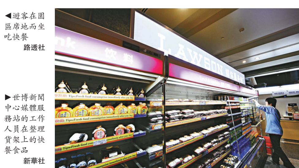
▲世博新聞中心媒體服務站的工作人員在整理貨架上的快餐食品

上海世博會除展示各國綜合國力外，同樣是「特色美食」競技場。對參展方來說，美食不僅能展示國家文化，同時能為場館吸引人氣；對遊客而言，不出國門吃遍世界當然不容錯過。因此，園區內多了不少特意來體驗各國美食的「世博饕餮一族」。