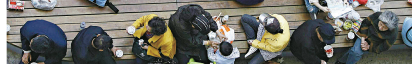
▲遊客在園區席地而坐吃快餐

世博「國宴」的大熱，讓上海商家看到了「錢景」，各酒店紛紛推出各類世博套餐，大賺「快錢」。上海虹橋迎賓館推出的世博國宴，包括了代表日本壽司、上海白斬雞、意大利三色果凍等在內的「混搭美食」；而台資上海神旺大酒店，則乾脆將由巧克力雕琢的世博菜餚則整桌佳餚採用「中西西做」的烹飪法，所有食材均源自中國各地，菜式不僅色香味俱全，同時保留了天然食材的原味。