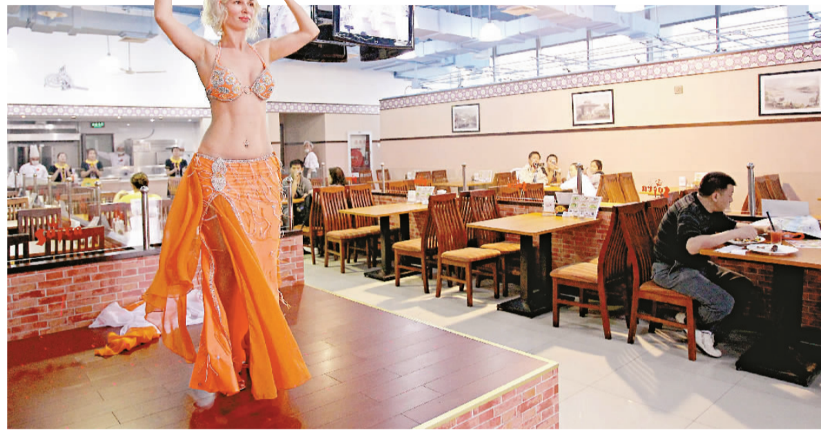
▲一位演員在土耳其皇家餐廳上海世博園店內表演舞蹈