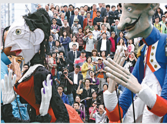
▲來自法國的街頭藝術家和巨型木偶，為遊客帶來當地特色的表演節目 新華社

駱家輝此行側重在向中國推銷清潔能源技術。中國正在加快經濟增長方式轉變，對於節能環保技術需求巨大，加上外匯儲備充裕，扮演最大買家的角色當仁不讓。中國人民大學國際關係學院副院長金燦榮認為，駱家輝此行將加強中美在新能源領域的合作，尤其是擴大美國清潔能源技術對華出口。