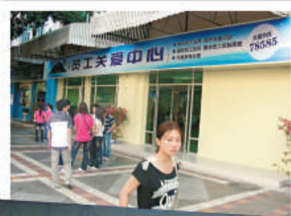
▲富士康建立員工關愛中心，施疏導員工壓力