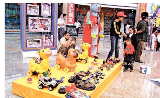
▲國產玩具應提高附加值，減弱「地攤貨」的形象

分析人士建議，應按照國際市場玩具生產標準要求嚴格檢測，避免通報、召回等惡性事件的發生；引導企業建立創新自主品牌經營，增加產品的技術含量和附加值；引導企業關注新興市場，避免對傳統市場的過度依賴。