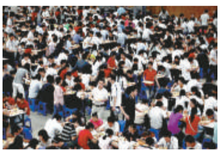
▲這是富士康員工在進餐，富士康園區每平方公里有十幾萬人，雖人海茫茫，工人與工人之間卻是「熟悉的陌生人」

隨著第九次跳樓事件發生，富士康介紹，這幾起跳樓事件中，死者的共同特徵是：年齡在18-24歲之間，入職時間不到一年。根據警方調查，心理問題是事件發生的主要原因。有內地傳媒採訪了多位心