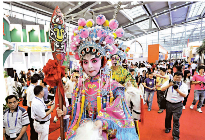
▲文博會：各地傳統文化齊爭鳴，圖為幾位身著戲服的演員在文博會1號展館巡迴展示

【本報記者黃仰鵬東莞十六日電】廣東東莞日前發布東莞市第二次經濟普查數據顯示，東莞企業法人單位總數為48349個，港澳台商投資企業和外資商投資企業10406個。相比2004年的首次普查數據，東莞企業法人單位總數增加15712個，增幅為48.14%；但港澳台商投資企業和外資商投資企業卻非增反減少1545家，降幅達13.65%。有專家稱，外企數量減少主要系外企向內陸轉移和受金融危機衝擊倒閉所致。