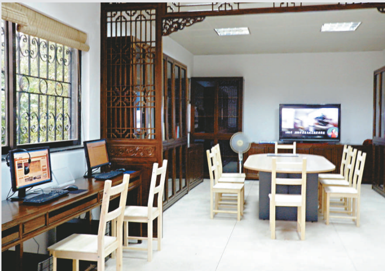
▲古色古香的盲人教育館

在盲人教育館裡，最受關注的還要數觸摸文物，目前已有鎮海樓屋簷的石灣彩釉鯊魚花脊、西漢南越王墓出土的「文帝行璽」、刻有「番禺」字樣的銅鼎等複製文物，可以讓盲人通過手的觸摸，了解到不同歷史時期的文物造型、工藝特徵等。以後廣州博物館還將籌備鋪設盲人通道，並甄選一批有代表性的出土文物，及相關文物的複製品，讓盲人觀眾可以更好地觸摸「文物」、了解歷史。