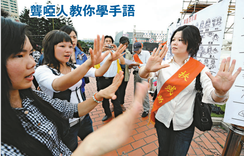
▲5 月 16 日是第 20 個全國助殘日，聾啞人志願者（右一）來到福州市五一廣場教市民學手語，讓更多的人們加入到扶殘助殘行列。

本地「無障礙電影工作室」已陸續製作了包括《非誠勿擾》、《第 601 個電話》、《紫日》等近 20 部無障礙影片，今年計劃再製作 40 部新電影。