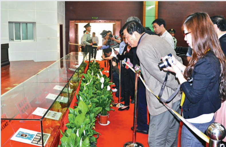
▲珍貴郵票為《中國古代書法——行書》郵票首發助興