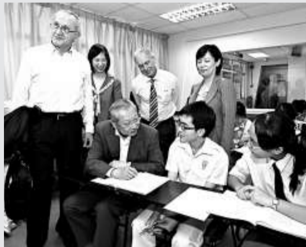
孫公外訪 教育局局長孫明揚及其率領的高等教育代表團，昨日展開在馬來西亞吉隆坡的訪問行程，參觀一所華文獨立中學——吉隆坡循人中學。訪問期間，孫明揚觀察學生上英文課，以及與學生在體育課打成一片。

四場生命教育講座，由生命教育學會與道聯會、圓玄學院和大公報合辦，協辦機構還有香港留台大學校友聯會、教育評議會、香港教育者工作聯會和鄰舍輔導會，歡迎師生和市民參加，免費入座。