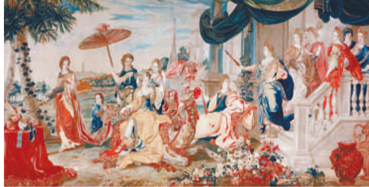
Lodewijk Van Schoor《四大洲》, Zada 畫廊