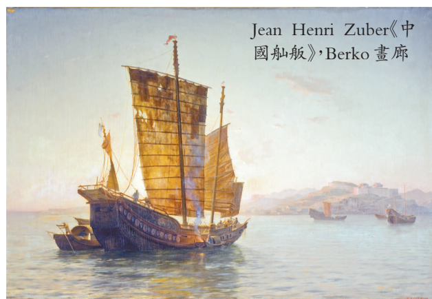
Jean Henri Zuber《中國帆船》, Berko 畫廊