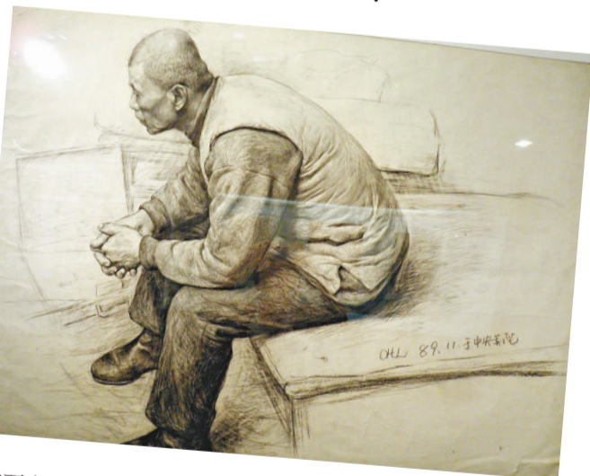
▲朱春林(一九八九年)《老人像》