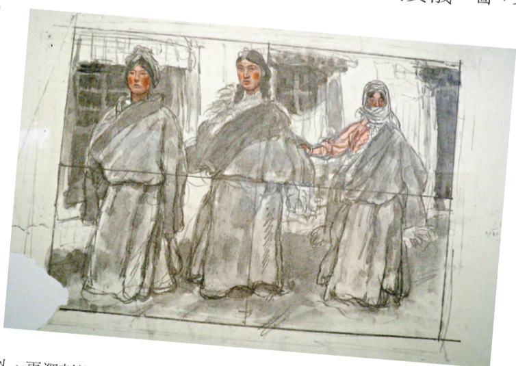
▲陳丹青(一九八〇年)《西藏草圖》

「精神與歷程」中央美術學院素描六十年全國巡迴展正在廣東美術館舉行，包括徐悲鴻、王式廓等數代畫家的素描、速寫、創作草圖六百餘套，濃縮了中央美術學院素描教學的歷程，同時也展現了教學思維方式的演進與轉變。