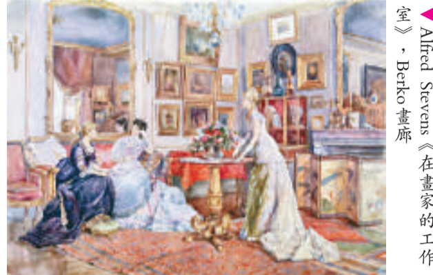
Alfred Stevens《在畫家的工作室》, Berko 畫廊

【本報訊】記者湯海峰上海報導：上海國際藝術精品展覽會日前在上海洛克·外灘源開幕。據主辦者尼克龍介紹，展覽會上，有超過二十個國家的國內外頂級藝術畫廊和珠寶商號到上海展示精品藝術和珠寶風采。