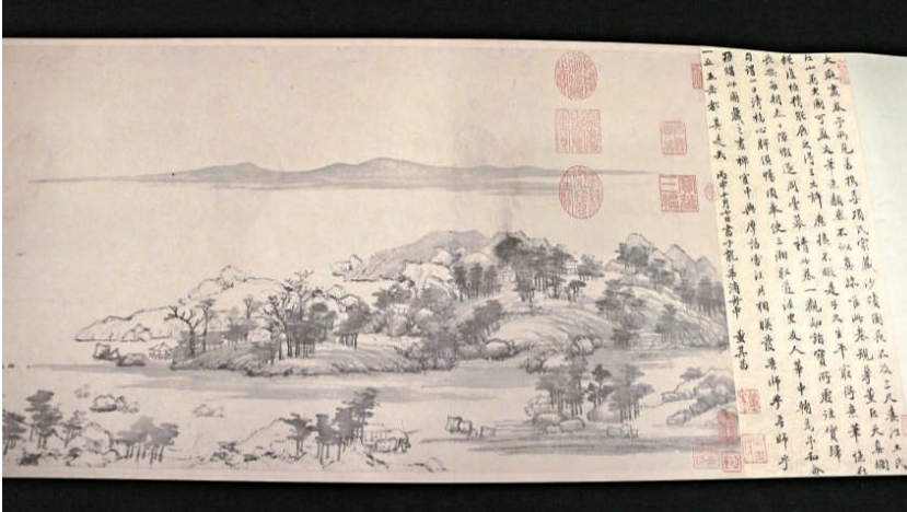
▲《富春山居圖》(局部)(複製品)中，有董其昌的題跋