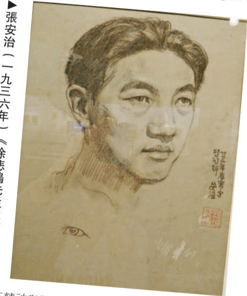
▲張安治(一九三六年)《徐悲鴻先生像》