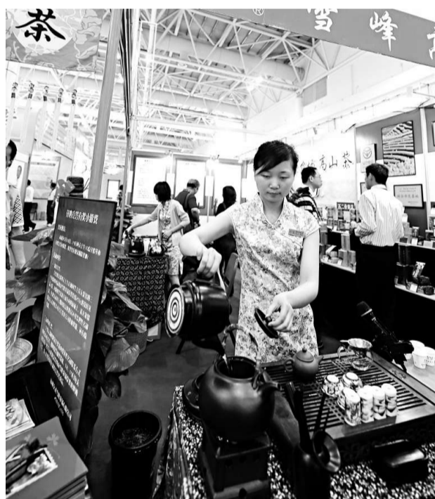
▶台商在第十二屆海峽兩岸經貿交易會上展示台灣綠色高山茶。

黨政人士認為，過去兩年，馬英九施政遭逢全球金融風暴的衝擊，受到很大的限制，也因此遭到許多批評，但路遙知馬力，行政團隊經過兩年埋頭耕耘、任勞任怨，堅持正確的政策方向，之前IMF評估今年台灣經濟增長率6.5%，通貨膨脹是1.5%，都是亞洲四小龍之首，用實際的經濟預測，肯定台灣的施政方向。現在洛桑的競爭力評估出爐，台灣大幅進步，首次擠進全球前10名，可說在「五二〇」就職兩周年前夕，選給馬英九兩年施政一個公道的評價。