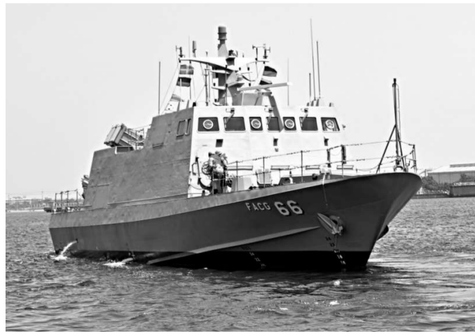
▲台灣海軍第一支「光華六號」飛彈快艇中隊18日成軍。

「光華六號」最大的特色，在於採用可以有效降低雷達反射的外型設計，也就是具有匿蹤功能，加上配備的雄二飛彈射程比原先「海鷗」級快艇上配備的雄一飛彈要遠，「光華六號」飛彈快艇將可以有效地執行制海打擊的任務。