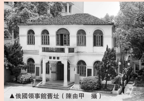
▲俄國領事館舊址