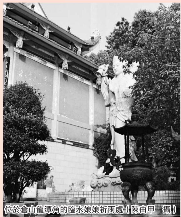
位於倉山龍潭角的臨水娘娘祈雨處