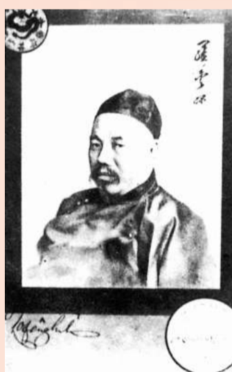
晚清中國著名外交家羅豐祿