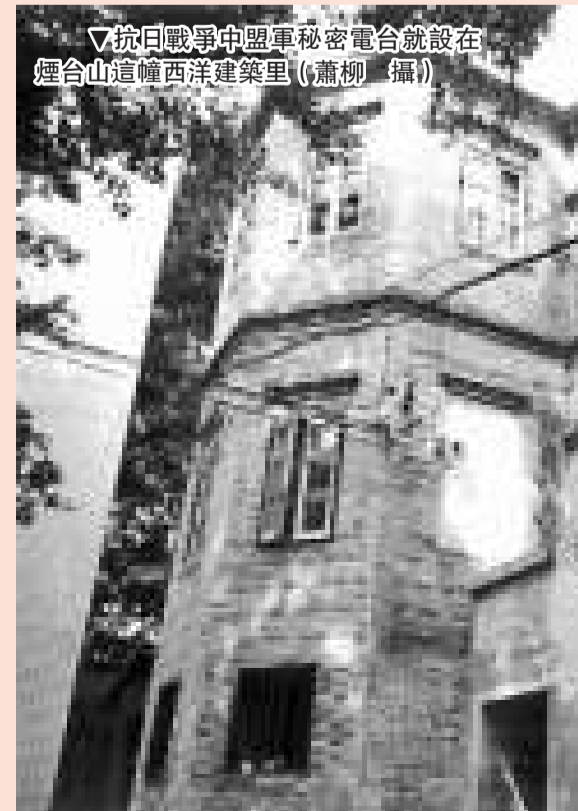
▽抗日戰爭中盟軍秘密電台就設在煙台山這幢西洋建築里