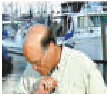
▲美國全國廣播公司一名主播不慎張嘴誤吞蒼蠅

則屬NBC今日秀（Today）節目主播馬克·波特，連線時不小心吞下蒼蠅，害得他忍不住當場咳了起來。