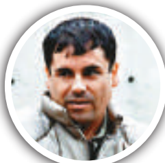
▲墨西哥頭號大毒梟古茲曼