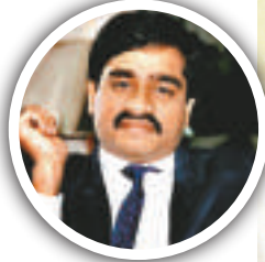
▲印度恐怖分子易卜拉欣