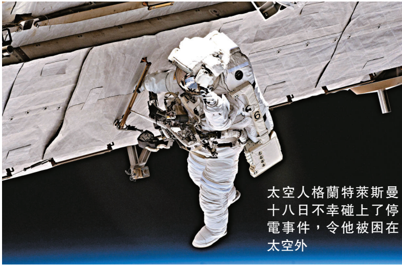
太空人格蘭特萊斯曼十八日不幸碰上了停電事件，令他被困在太空外