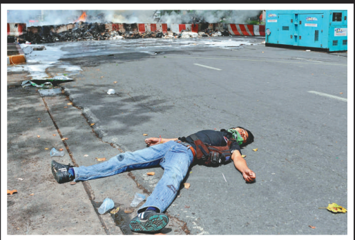
▲一名示威者頭部中彈，伏屍街道