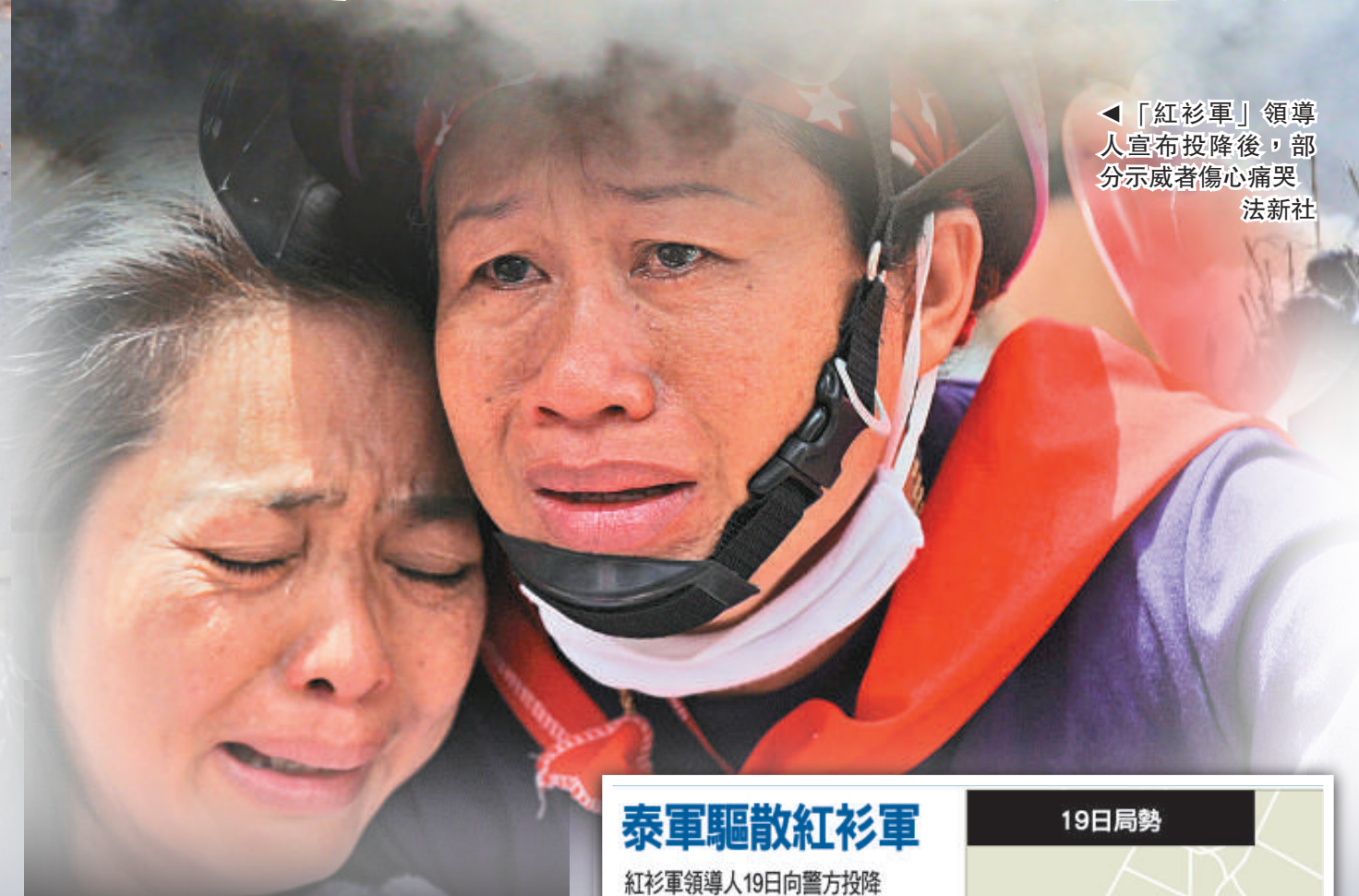
◀「紅衫軍」領導人宣布投降後，部分示威者傷心痛哭

【本報訊】綜合通訊社曼谷十九日消息：泰國軍方星期三清晨採取武力清場行動，造成至少六人死亡，五十八人受傷，死者包括一名意大利記者。下午，七名「紅衫軍」領袖向警方自首，結束了持續了兩個多月的示威行動。不過，部分示威者拒絕投降，四出縱火搶掠。泰當局隨後宣布，在曼谷及全國二十三個省府實施宵禁，並對任何煽動暴亂的人格殺勿論。