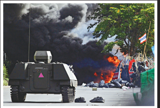
▲數輛裝甲車開入示威者陣地