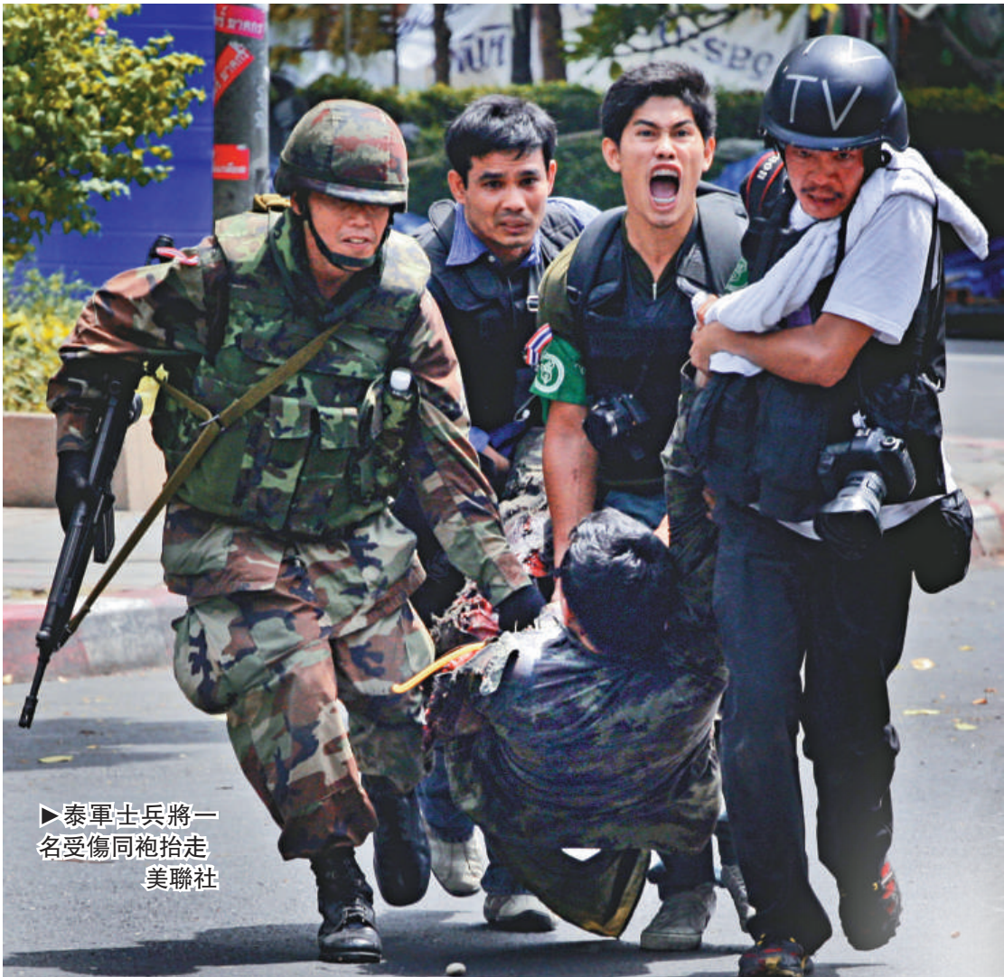
►泰軍士兵將一名受傷同袍抬走