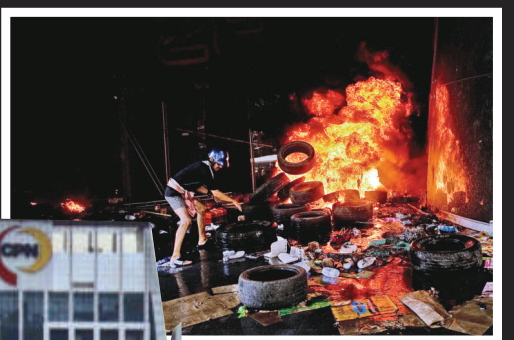
▲示威者在商場入口焚燒車胎