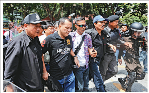
▲數名「紅衫軍」領袖被警方帶走

泰國政府緊急狀態公共管理中心發言人訥森發表電視講話說，曼谷的局勢已經在軍方控制下，但部分地區還有搶劫與縱火事件發生。當局隨後在曼谷實施宵禁，時間由當晚八時至二十日早六時，以防止暴亂，宵禁令隨後擴大至全國二十三個省府。軍警還設立多處檢查站，嚴格控制人員出入首都。