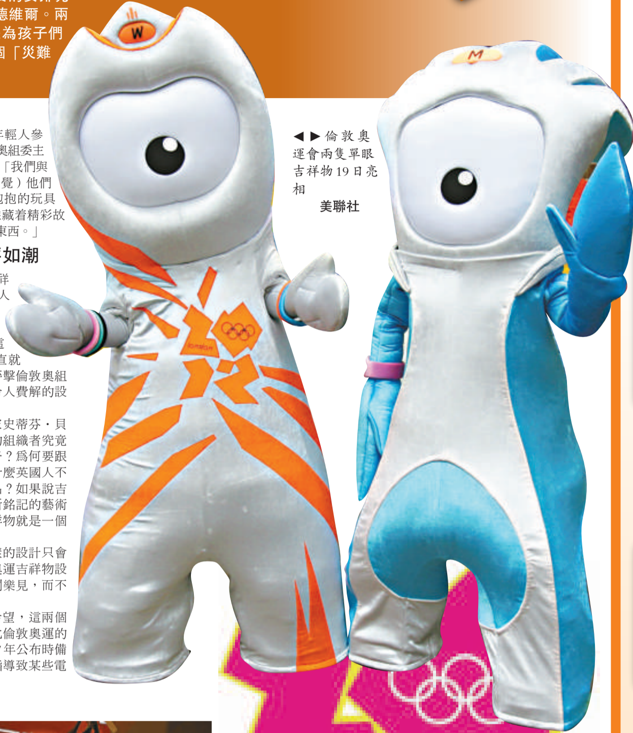
倫敦奧運會兩隻單眼吉祥物19日亮相

此前，主辦單位希望，這兩個吉祥物得到的反應會比倫敦奧運的標誌正面。該標誌2007年公布時備受嚴厲批評，甚至被指導致某些電視觀眾的癲癇症發作。