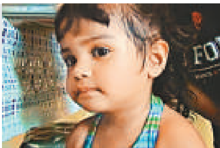
▼美國一名女童半夜坐在馬路中間，險釀悲劇 互聯網