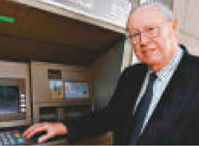
▲提款機之父巴倫15日病逝