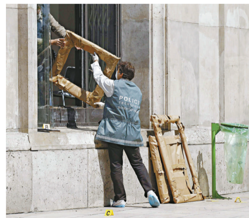
▲警方檢查被竊名畫畫框