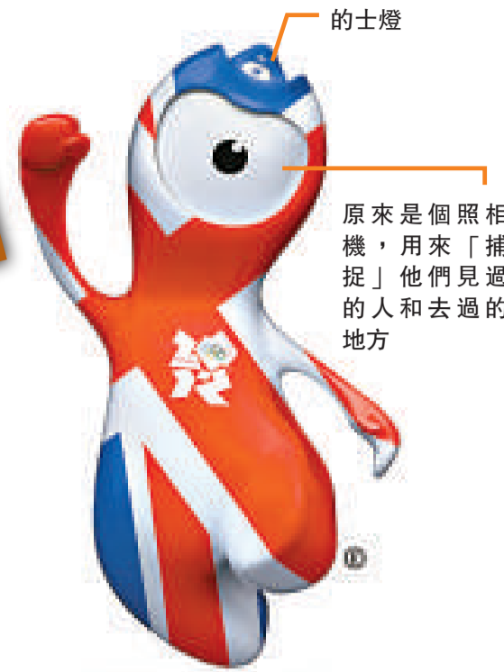
的士燈 原來是個照相機，用來「捕捉」他們見過的人和去過的地方