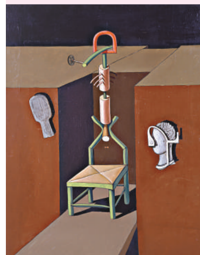
▲維克多·布洛納《另一個版本》，布面油畫，現代美術館