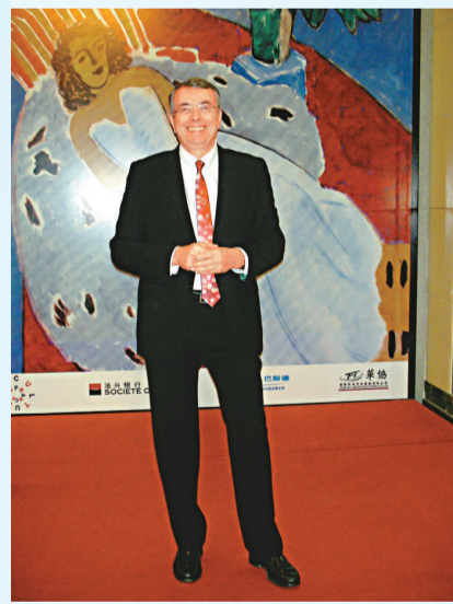
▲法國羅納—阿爾卑斯大區主席讓·雅克·凱拉納接受記者採訪

作爲二〇一〇年上海世博會期間在上海美術館舉辦的中法兩國重要文化藝術活動之一，「變奏的身體：法國羅納—阿爾卑斯大區五大美術館藏品展」由即日起至六月一日在上海美術館三樓舉行。此展覽由法國羅納—阿爾卑斯大區推出，由上海美術館和里昂美術館共同主辦。法國羅納—阿爾卑斯大區主席讓·雅克·凱拉納一行藉着出席上海世博會的機會專門爲展覽剪綵並作推廣。