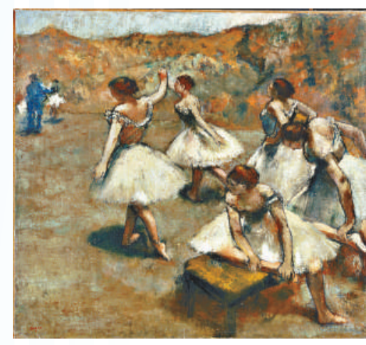
▲埃德加·德加《舞台上的舞者》，布面油畫，里昂美術館

法國的藝術世界聞名，所到之處總能引來無數追捧。是次上海世博會的法國國家館也因有巴黎奧賽博物館七