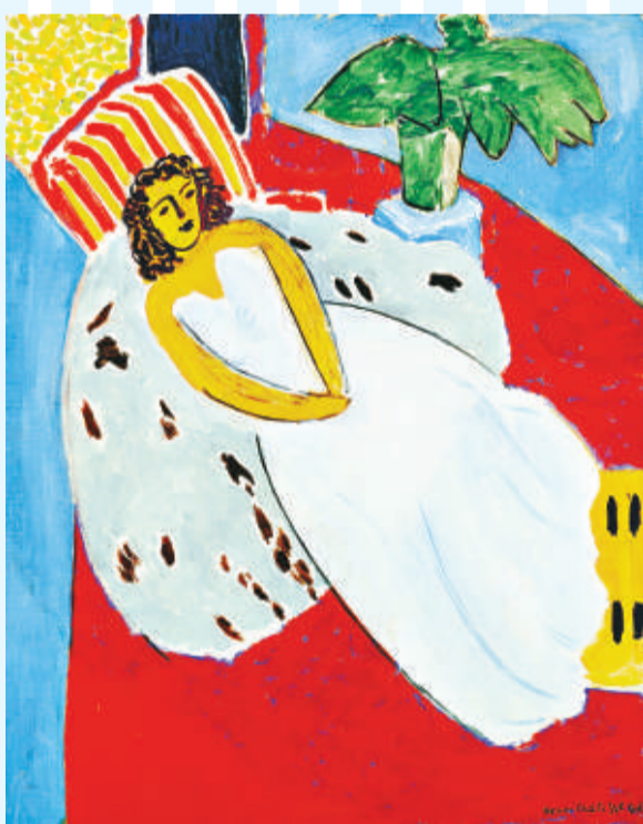
▲亨利·馬蒂斯《穿白裙子躺着的模特兒》，一九四六，里昂美術館