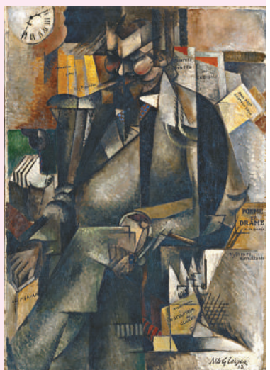
▲阿爾伯特·格萊茲《歐潔納·菲基爾編輯》，布面油畫，里昂美術館