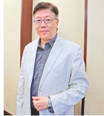
▲《沉默是針》劇照 香港話劇團藝術總監陳啟權

【本報訊】記者黃寶儀廣州報導：第九屆中國藝術節參節節目《沉默是針》本月二十一至二十二日在廣州廣聯禮堂公演兩場，這是香港話劇團廣州首演，香港話劇團藝術總監陳啟權表示希望用該劇來試探廣州的市場反應，借此機會打開珠三角市場。