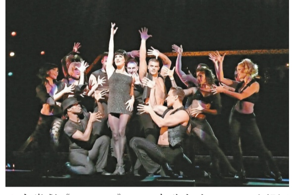
▲音樂劇《Chicago》現正在港上演