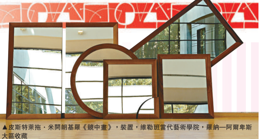
▲皮斯特萊施·米開朗基羅《鏡中畫》，裝置，維勒班當代藝術學院，羅納—阿爾卑斯大區收藏

幅法國國家珍藏品而受到注目。選擇在此時辦展，是否會擔心被搶風頭？羅納—阿爾卑斯大區主席讓·雅克·凱拉納果斷地說不擔心。法國館只有七件國寶，而在「變奏身體」展覽中，從雷諾阿作品開始，到畢加索、德加等等，直至當代藝術，可謂件件珍品，完整展現了二十世紀藝術家對人體的理解。該展覽按這百年來西方藝術風格的演變，分七個部分展開，分別是：1.接近身體；2.形象的分解；3.機械的身體；4.直觀的身體；5.不可能的形象；6.炫耀的身體；7.出現與消失。