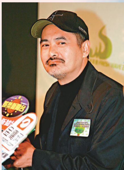
▲發哥多次被指耍大牌 資料圖片