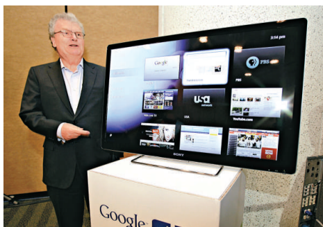
索尼將聯手谷歌推出「上網電視」

谷歌電視利用谷歌的Android軟件及Chrome網絡瀏覽器操作，用家可以使用索尼即將推出的上網電視機來上網，或使用