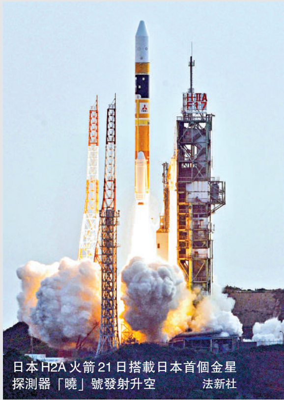
日本H2A火箭21日搭載日本首個金星探測器「曉」號發射升空