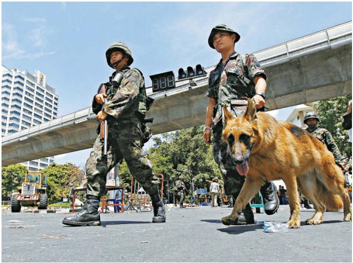
▲泰國軍人攜帶警犬搜索「紅衫軍」有沒有留下危險物品

泰國財長差提卡瓦尼周五早上在東京出席一個研討會及發表講話時指出，如果曼谷過去24小時的穩定局面可以持續下去，泰國的經濟很快便會復原。不過，他承認，接二連三的示威和暴亂，對泰國今年的旅遊業帶來災難性打擊。