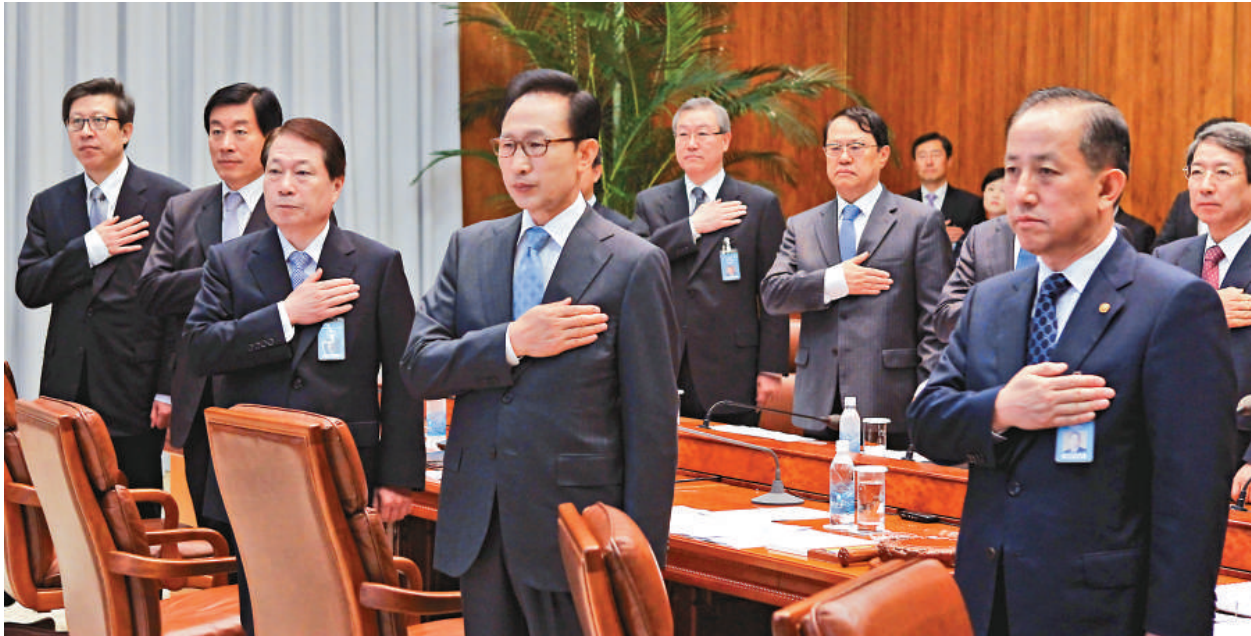
▲韓國總統李明博（中）與他的內閣成員在國安會前向國旗敬禮

他表示，這次會議的主要目的是討論軍事層面、南北關係層面、國際層面以及對韓國經濟的影響等方面的問題。李明博表示，他將以當天會議內容