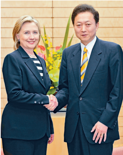
▲美國國務卿希拉里會見日本首相鳩山由紀夫