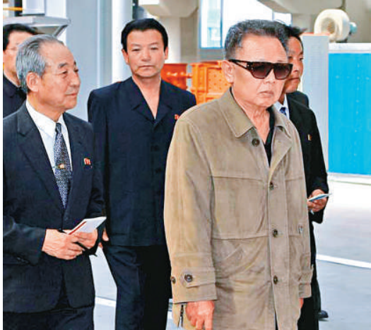
▼朝鮮最高領導人金正日（右）在咸鏡道視察