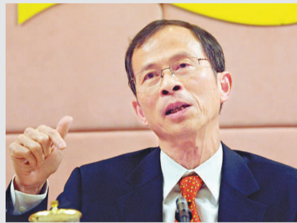
▲曾鈺成表示自己樂意出任電視政改辯論的主持

曾鈺成認為，今次辯論對市民是好事，有助大家了解政府的政改方案，而反對聲音亦能夠表達。問及其他反對派政黨不獲邀參與辯論，曾鈺成說，如果政黨之間有共同目標，不認為其他力量可以做成分化。