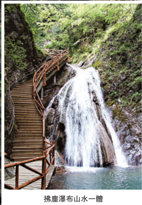
拂塵瀑布山水一體

金絲峽的獨美之處就在於山水交相呼應，令人嘆為觀止，無愧於「峽谷奇觀、生態王國」之美譽。