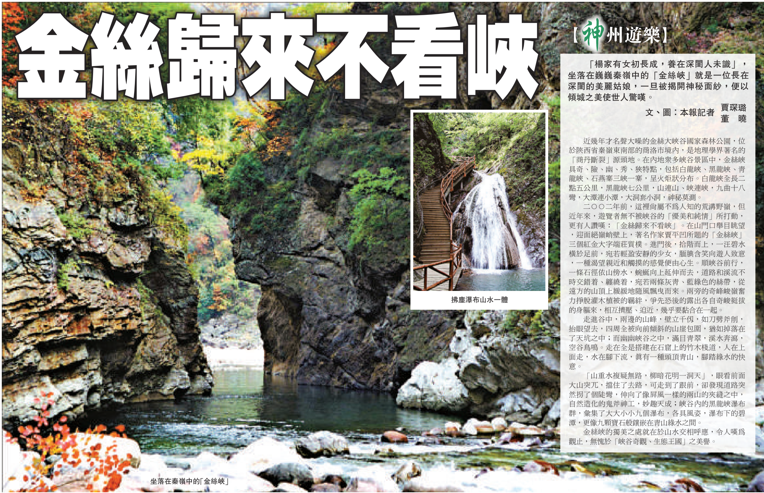
坐落在秦嶺中的「金絲峽」