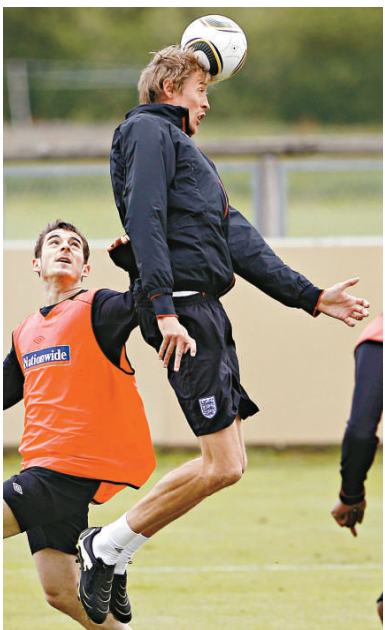
長人中锋高治有望正選上陣

隨着歐洲戰線陸續結束，各路征戰世界杯決賽周的雄師，備戰工作亦逐漸白熱化。英格蘭大軍會合後，將會進行兩場熱身賽，周一首場比賽迎戰墨西哥，正是為應付踢法相似的同組對手美國。