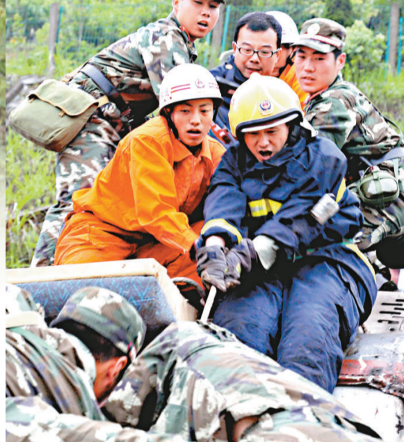
現場正在緊急救援