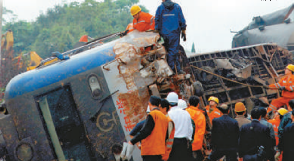
近萬名人員參與搶險救災