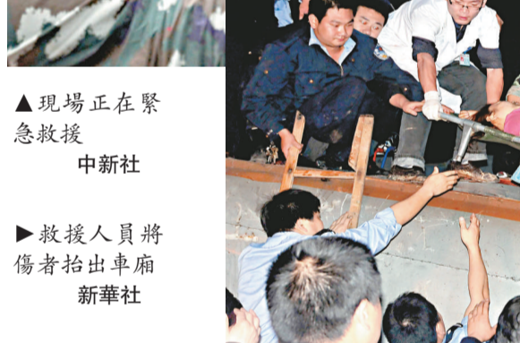
救援人員將傷者抬出車廂

綜合中新社及新華社23日消息：出事列車有17個車卡，23日2時許，因連日降雨造成山體滑坡掩埋線路，由上海開往桂林的K859次旅客列車，運行至江西省境內滬昆鐵路余江至東鄉間，發生脫線事故，車頭及9個車卡出軌，部分車卡翻側，中斷上下行線路行車，滬昆鐵路列車服務暫停。