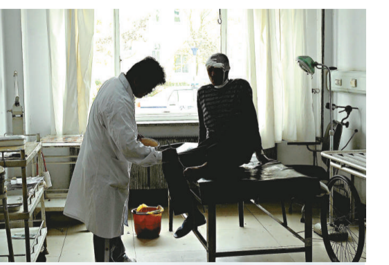
遼寧車禍傷員得到及時救治