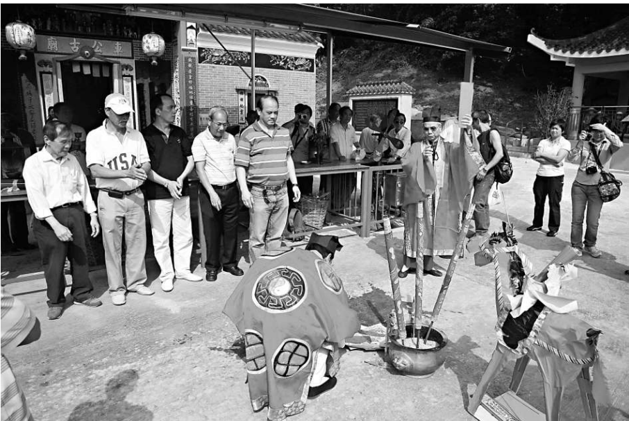
蠔涌聯鄉村民為太平清醮舉行上表儀式