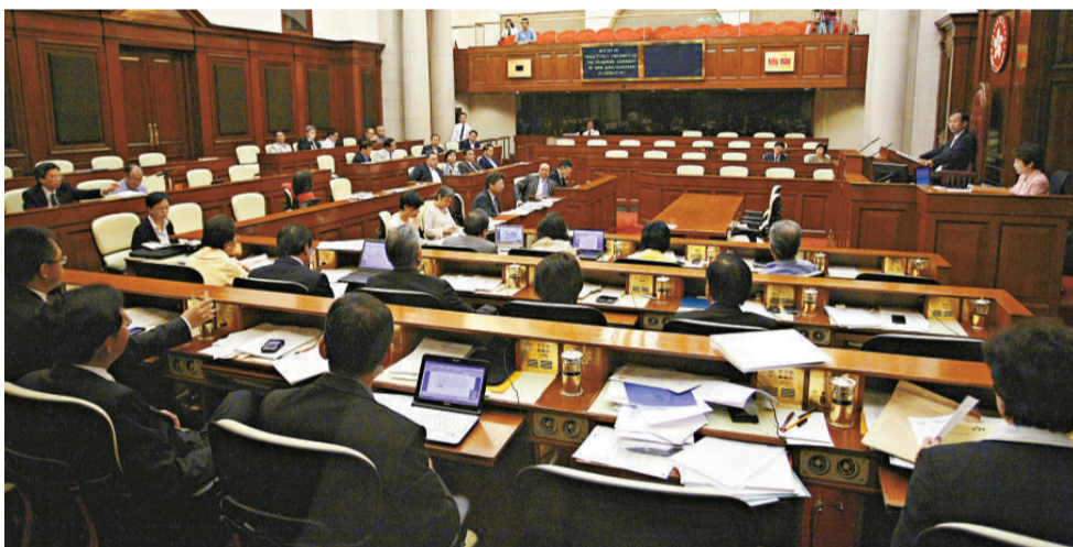
▲立法會昨通過動議，促請政府積極執行粵港合作框架協議，加強對港資企業支援

本港律師行希望未來簡化程序，可自行進入內地開業，不必再與內地的律師行聯營開辦。有醫生則盼新一輪的CEPA簽訂，可以進一步細化內地執業申請步驟。