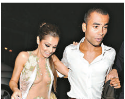
▲ Cheryl Cole (左) 日前正式向法院申請與艾殊利高爾離婚

Cheryl 不但沒有向艾殊利要一便士，而且將出人意料地遷出他們的薩里郡豪宅，把其留給艾殊利。她希望迅速辦妥手續，與艾殊利一刀兩斷，不想爲錢爭拗，好讓自己盡快展開新生活。一名消息人士表示，她完全接受兩人的關係已無可挽回的事實，她對艾殊利沒有仇恨，處理離婚時極爲成熟和顧念對方。她考慮到丈夫是英格蘭國家隊的後防主力，南非世界杯又快將開鑼，艾殊利要專心準備和比賽。Cheryl 的律師本來打算在7月才開始辦理離婚手續，但她希望兩人的事可以在世界杯6月11日開幕前了斷，因此決定提早行動，而且確保兩人不會就離婚條件發生爭拗。消息人士透露，Cheryl 一點也不留戀她原本