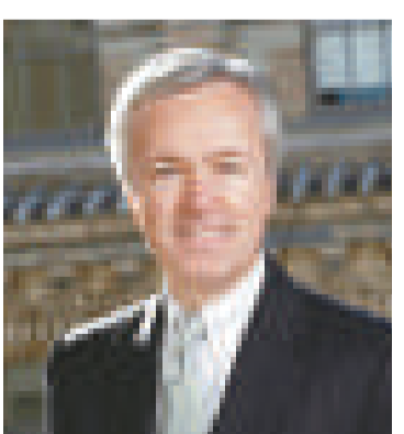
【本報訊】據彭博社26日報導：《彭博市場》雜誌26日公布「金融五十」排行榜，列舉華爾街行政總裁2009年的收入。現年56歲的富國銀行行政總裁約翰·斯頓夫（見圖）在排名榜上居第一名，他在2009年的薪酬和股份收入達2130萬美元（約合1.66億港元），比他2008年的收入增加了不只一倍。

旅行者保險公司行政總裁傑伊·什非曼排名第二，收入為2060萬美元，升幅為42%，收入主要來自股份、期權和其他以公司業績爲主的分紅。集寶保險集團的約翰·芬尼根排名第三，收入為1920萬美元，升幅為13%。