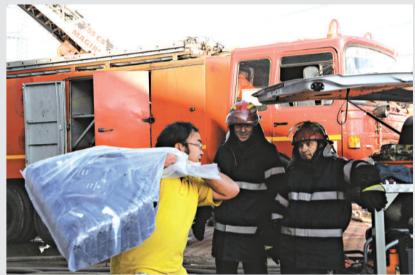
▲一名華裔（左）奮力挽救損失

■羅馬尼亞首都布加勒斯特東北郊的紅龍中國商品市場26日早晨失火，兩個大型商廈已基本燒燬，一名當地消防員在滅火中犧牲，4名消防員受傷。