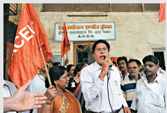
▲印航員工在辦公室外示威

由於法院下令和民航部長警告，印度航空公司有2萬名員工的工會取消了罷工。工會透過電視表示，工會瞭解管理層的情況，他們晚上恢復工作。印航旗下平價航空公司印航快捷航空公司22日在卡納塔卡省失事，管理階層對員工下封口令，要求不得對媒體透露消息；加上遲發薪金，工會自25日下午發起罷工。目前正值暑假運輸高峰，受罷工事件影響，印度航空公司取消逾100班國際和國內航班，3萬乘客受到影響。