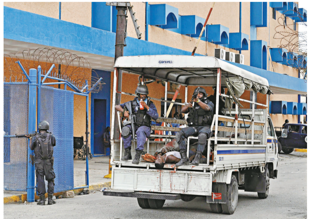
▲暴力事件已令金斯敦變成戰場，警察25日護送一輛裝滿屍體的貨車進入市內一間醫院

牙買加當局宣布在金斯敦地區實施為期一個月的緊急狀態。金斯敦的學校25日全部停課，商店停業。