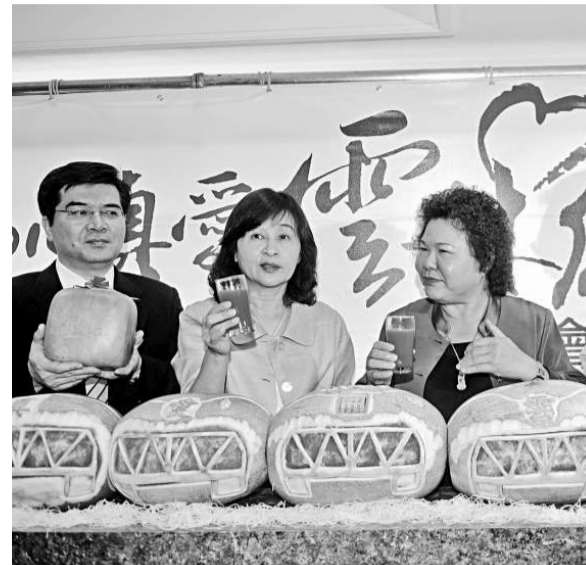
▲高雄人均負債全台第一，圖為高雄市長陳菊（右）27 日出席活動

此外，《遠見》雜誌的「今年縣市長施政滿意度調查」首度設立「最佳進步獎」，依民衆給縣市長的