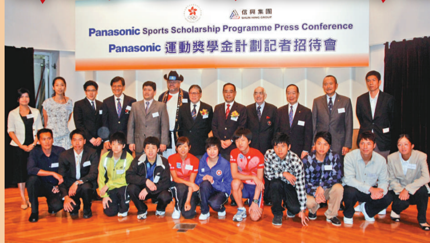
▲港協暨奧委會與信興集團聯手推出運動獎學金計劃，後排右六為港協暨奧委會會長霍震霆

此外，港協暨奧委會與信興集團攜手推出Panasonic運動獎學金計劃，信興集團共撥出150萬元資助香港具潛質運動員備戰2012年倫敦奧運會。港協暨奧委會又與Adecco香港簽署合作協議，加強運動員退役後支援。