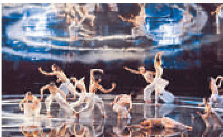
▲《水月》是雲門舞集90年代巔峰之作

1973年由林懷民創立的台灣現代舞團「雲門舞集」，經常到世界各地演出，如歐、亞、美、澳洲等，好評無數，不僅帶動台灣的現代舞發展，也讓西方國家對亞洲的當代舞蹈刮目相看。倫敦《泰晤士報》予林懷民高度讚許：「以任何標準去衡量，雲門是一個極端優秀的舞團，林懷民的編舞技法完美，嚴謹有力，扣人心弦，同時，美麗非凡。」