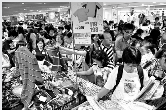
▲一田百貨減價首天，吸引 13 萬人次掃貨，全場迫爆