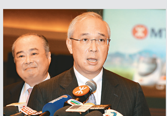
▲港鐵主席錢果豐指公司採進取性派息政策