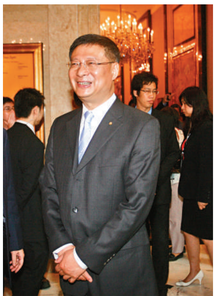
▲中行行長李禮輝希望H股融資今年內完成

內地計劃五年後落實電信網、廣播電視網、互聯網的「三網融合」，相當技術及設備股份獲追捧。中國無線(02369)急升17.8%，收報3.01元，TCL通訊(02618)亦升14%至3.42元，而京信通信(02342)及晨訊科技(02000)股價亦升逾11%。另外，聯想(00992)去年扭虧為盈，股價偷步炒上近4%至4.77元。