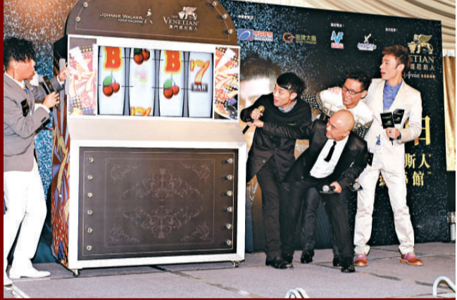
▲四子難得正正经經拍照