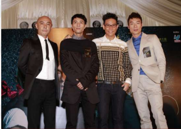
▲四子拉老虎機，表情各異