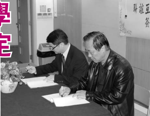
▲兩校簽互訪協議 ▲北京學生到保良李城璧中學交流

受祖國的繁榮與偉大。兩校初步擬訂合作內容包括定期舉辦諸如京港兩地學生座談、進班聽課等增進友誼京港兩地師生開展聯誼互訪活動，以及組織兩校家長互訪、觀摩及交流等活動。藉着上述豐富及多元化的活動，實可望加強京港兩地的師生、家長相互了解和認識。