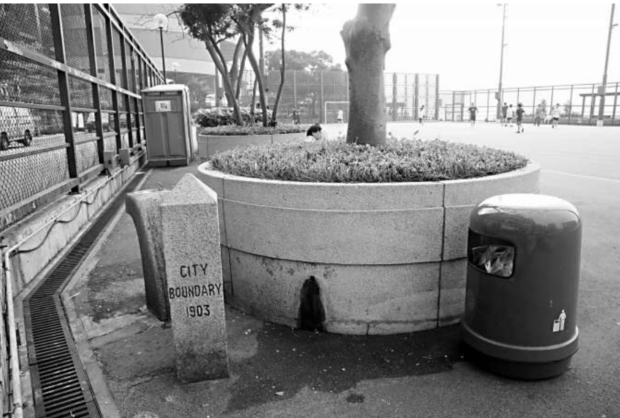
▲堅尼地城西寧街公園的維多利亞城界石